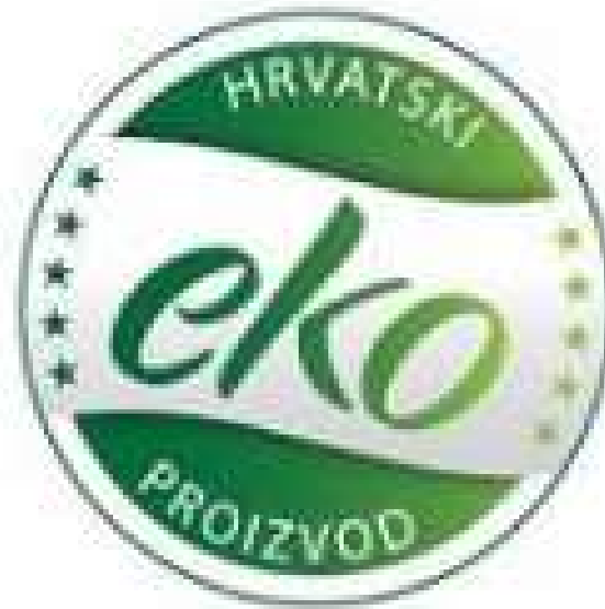
Slika 4. - Hrvatska eko oznaka

Da bi proizvod bio okarakteriziran kao ekološki mora biti proizveden sukladno Zakonu o ekološkoj proizvodnji poljoprivrednih i prehrambenih proizvoda i mora imati certifikat koji je garancija da taj proizvod ne sadrži razne supstance odnosno genetski modificirane organizme i ostalo (Agroklub, 2015).