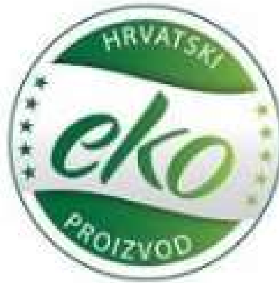
Slika 4. - Hrvatska eko oznaka

Da bi proizvod bio okarakteriziran kao ekološki mora biti proizveden sukladno Zakonu o ekološkoj proizvodnji poljoprivrednih i prehrambenih proizvoda i mora imati certifikat koji je garancija da taj proizvod ne sadrži razne supstance odnosno genetski modificirane organizme i ostalo (Agroklub, 2015).