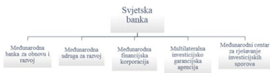
Slika 1. Struktura Svjetske banke