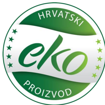
Slika 3. Hrvatski eko znak