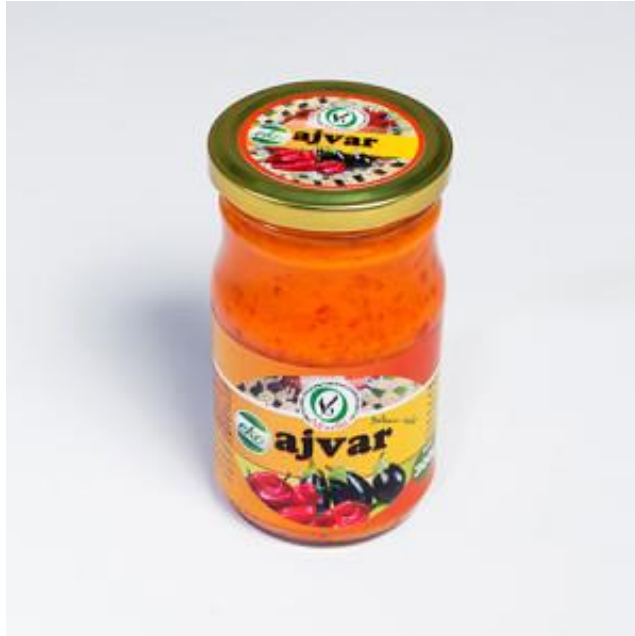
Slika 12. Eko proizvod - ajvar - OPG Veselić