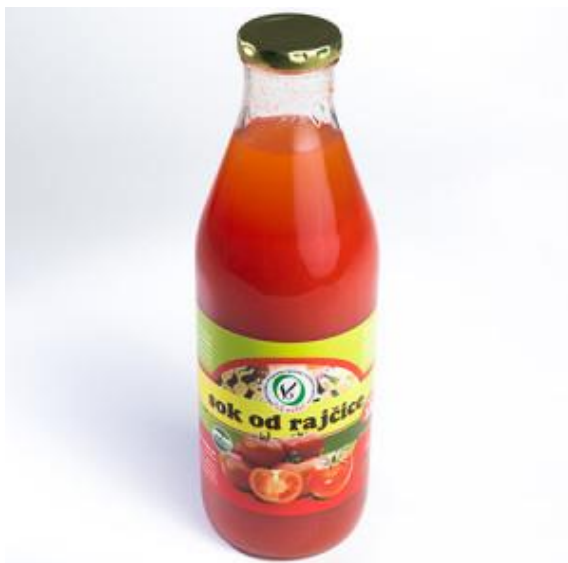
Slika 10. Eko proizvod – sok od rajčice – OPG Veselić