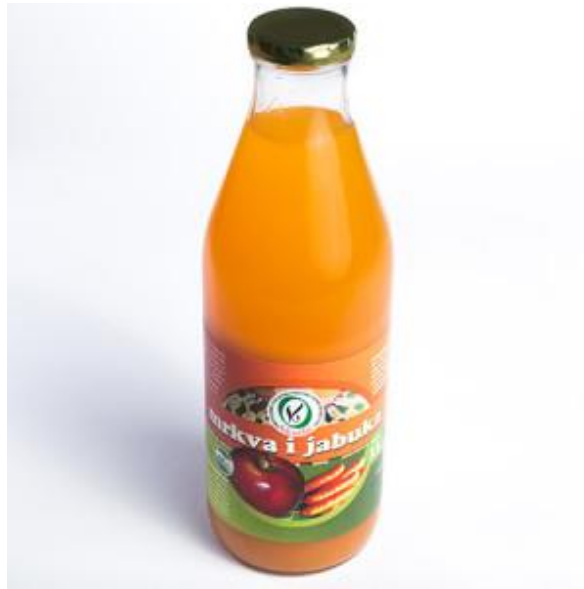
Slika 9. Eko proizvod – sok od mrkve i jabuke - OPG Veselić