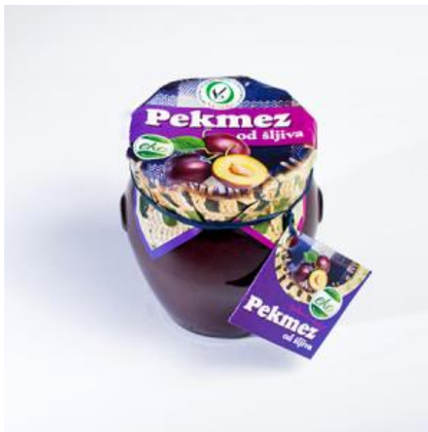
Slika 11. Eko proizvod - pekmez od šljiva - OPG Veselić