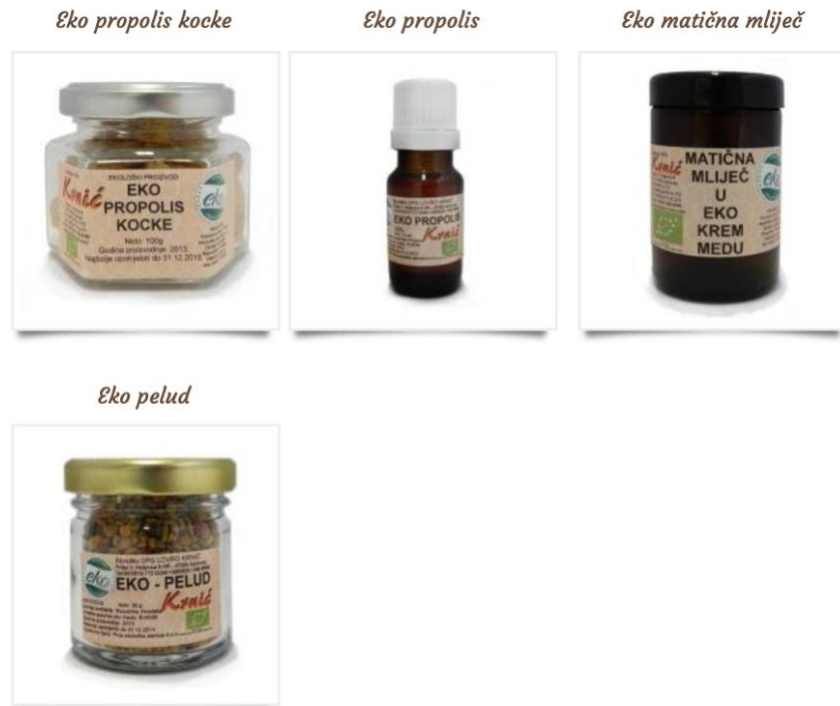
Slika 8. Proizvodi od pčela - Ekološko OPG pčelarstvo Krnić