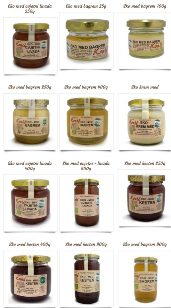
Slika 6. Ekološki med – Ekološko OPG pčelarstvo Krnić