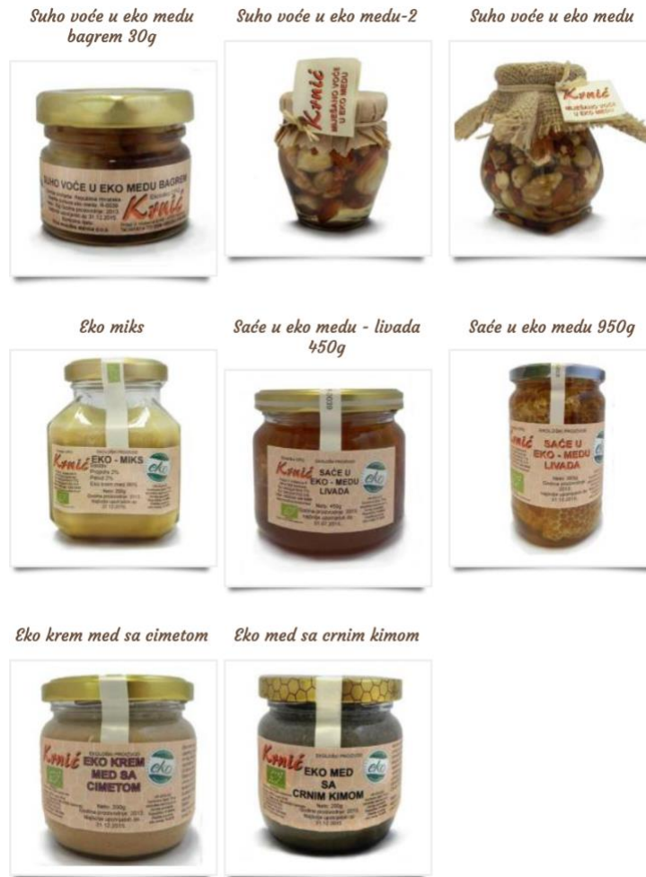
Slika 7. Pripravci s medom - Ekološko OPG pčelarstvo Krnić