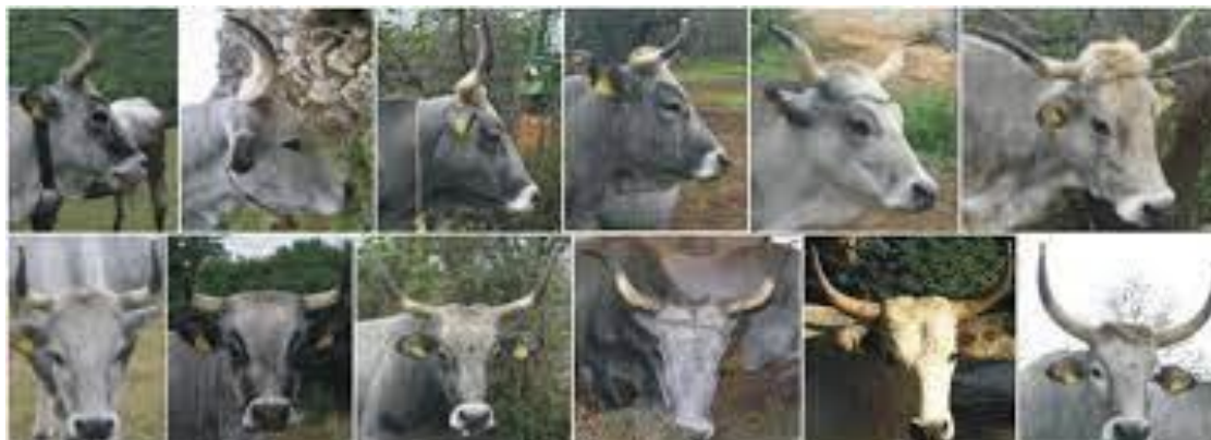
Slika 1. Prikazuje Istarsko govedo i njegove raznovrsne oblike rogova koje posjeduje.

adut u odbrani o raznih predatora koji su u to vrijeme goveda smatrali lakim plijenom, ovisno o situacijama i tijekom vremena s kojim se govedo moralo suočavati ono je razvijalo rogove prema svojim potrebama. Dakle rogovi predstavljaju glavni obrambeni mehanizam, zato se nekim govedima rogovi odstranjuju u ranoj dobi, upravo zbog toga kako se ne bi ozlijedili u slučaju igre ili tuče, također i kako prilikom hranjena ili mužnje ne bi ozlijedili čovjeka. (Pavo Caput, 1996)