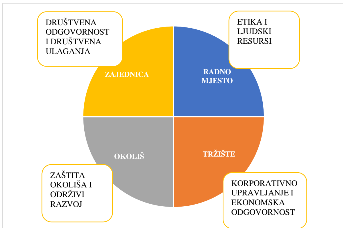
Slika 1. Ciklična matrica društvene odgovornosti poduzeća

Društvena odgovornost višedimenzionalni je konstrukt koji obuhvaća četiri podskupine ekonomskih, pravnih, etičkih i dobrovoljnih filantropskih odgovornosti (Carroll, 2015). Slika 1. prikazuje cikličnu matricu društvene odgovornosti poduzeća.