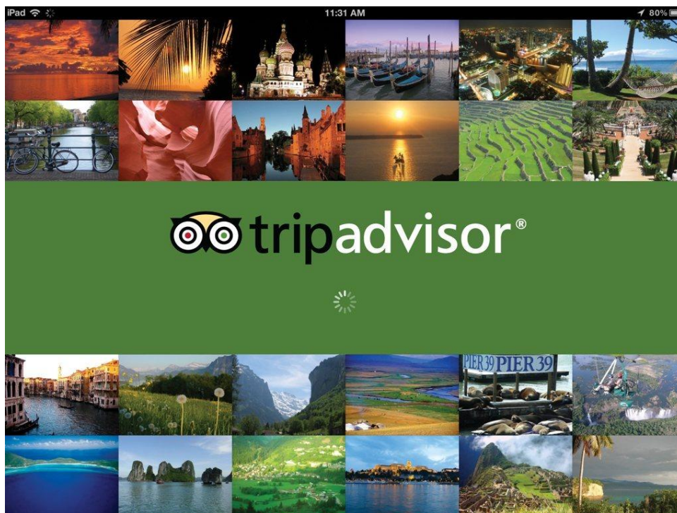
Slika 3 Primjer TripAdvisor oglašavanja