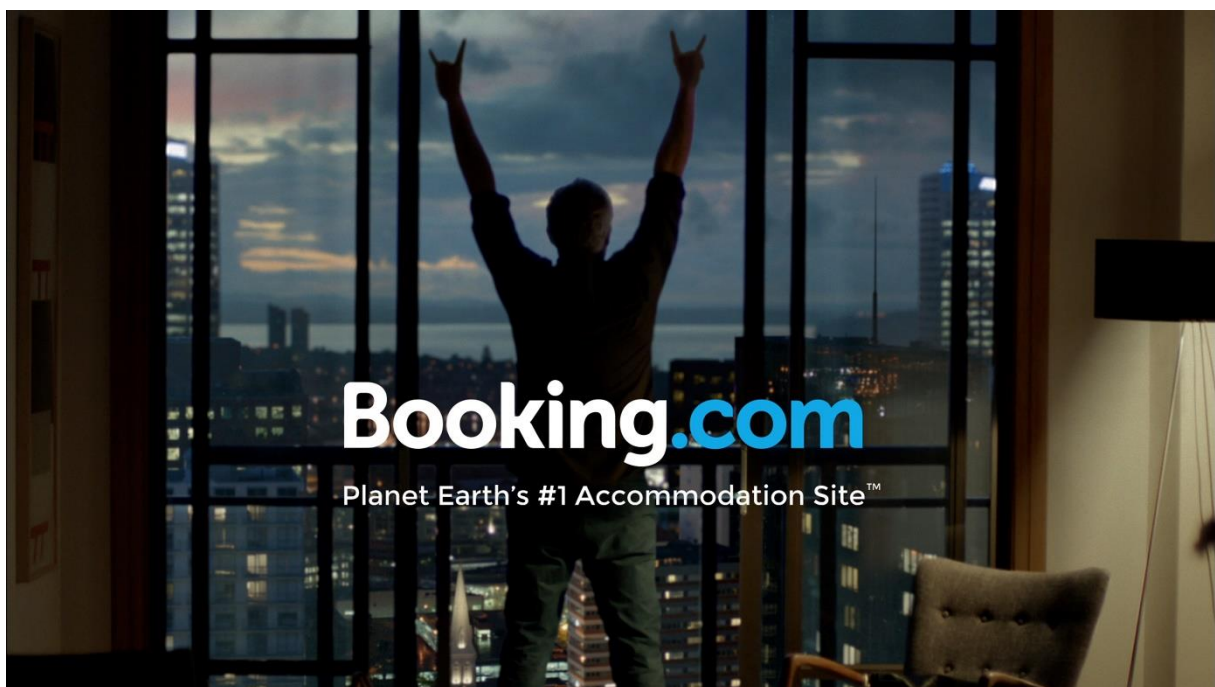
Slika 2 Primjer Booking oglasa

Rezervacija se smatra valjanom tek onda kad je zadobiven dokaz o uplati, a ugostiteljsko poduzeće može zahtijevati i polaganje akontacije. U redovnom poslovanju otkaz rezervacije od strane hotela se neće dogoditi, dok gost ima pravo na otkaz rezervacije (u vrijeme sezone 3-7 dana ranije), ali hotel i dalje ima pravo na naknadu štete.