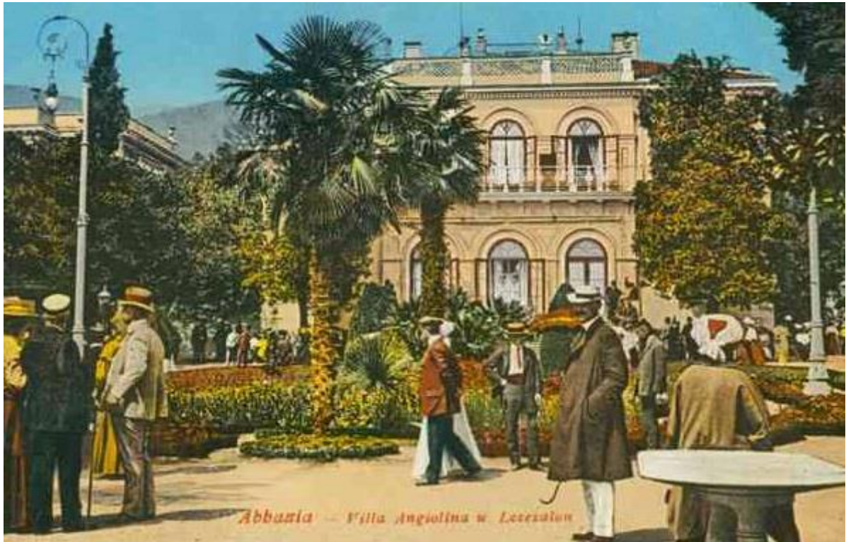
Slika 1. Villa Angiolina u Opatiji

Intenzivan razvoj u RH kreće u dugoj polovici 20. stoljeća gdje se masovno kreće s gradnjom hotela i drugih ugostiteljskih objekata. Od samih početaka pa sve do sad ugostiteljstvo na prostorima Republike Hrvatske ima vrlo posebno značenje, npr. 2010. godine je čak 7,7% stanovnika bilo je zaposleno u ugostiteljstvu. Te iste godine brojimo čak 15.529 ugostiteljskih jedinica što označava dvostruki rast u usporedbi na 1970. godinu. Unatoč gospodarskoj krizi između 2008. do 2011, bilježio se godišnji rast od 1,3%.