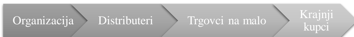
Slika 1. Primarni način rada organizacije PepsiCo