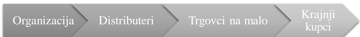
Slika 1. Primarni način rada organizacije PepsiCo