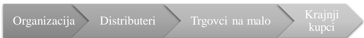
Slika 1. Primarni način rada organizacije PepsiCo