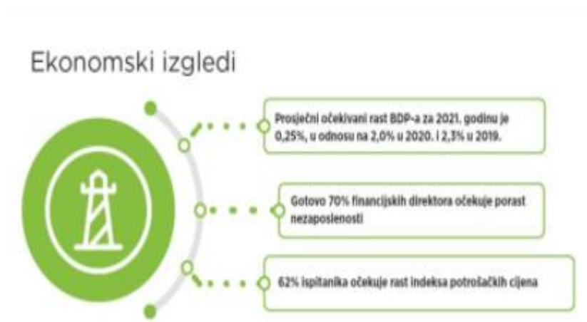
Slika 4: Ekonomski izgledi