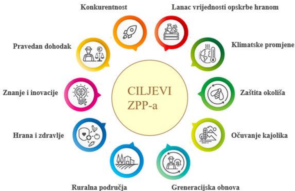
Slika 1. Ciljevi novog ZPP-a

Izvor: Vlastita izrada autora prema podacima ec.europa.eu (2022). Deset ključnih ciljeva.