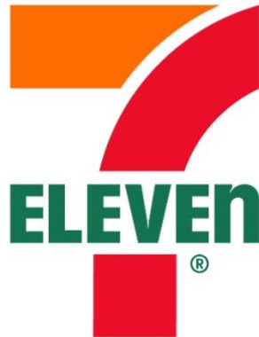
Slika 5. 7-Eleven logo