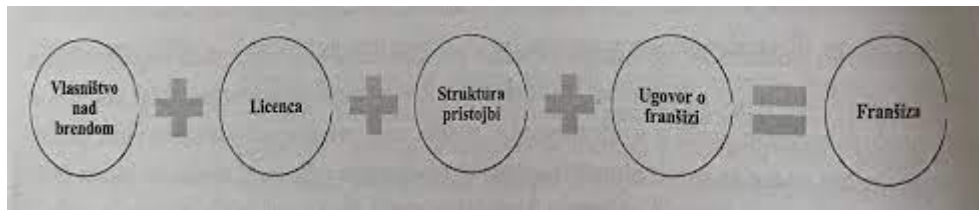
Slika 1. Osnovne karakteristike franšiznog sistema