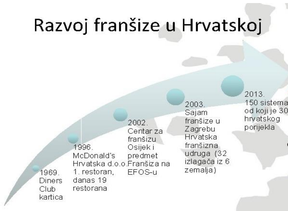
Slika 2. Vremenska lent razvoja franšize u Hrvatskoj