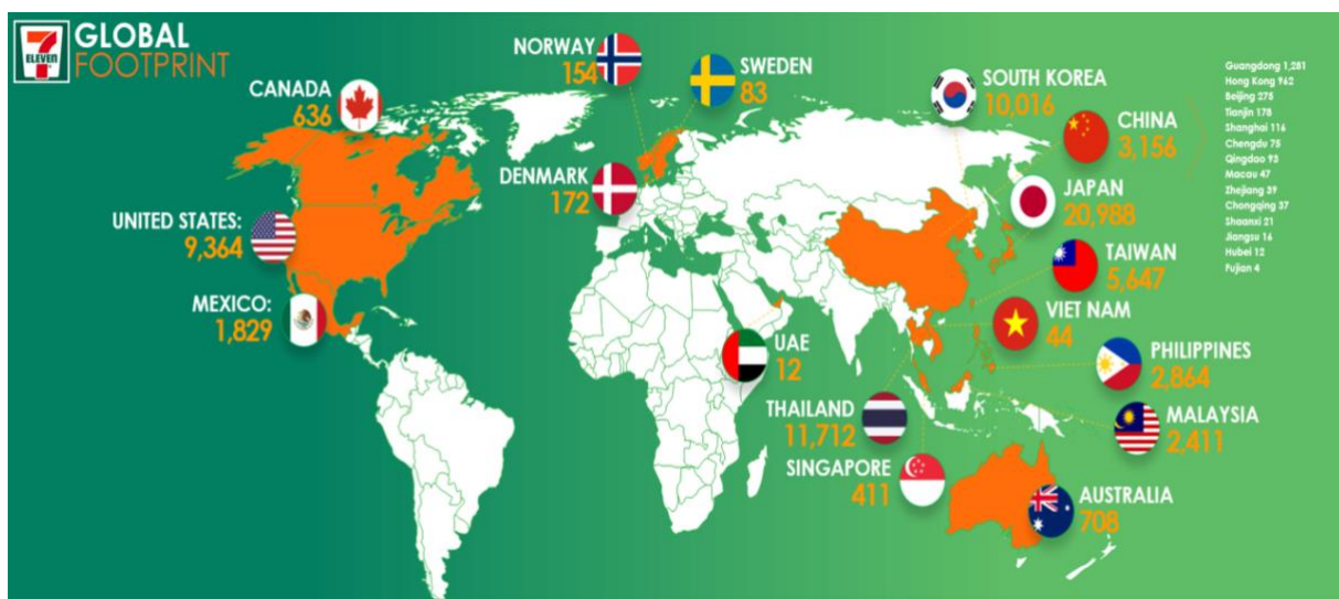
Slika 4. Prikaz 7-Eleven franšize u svijetu

7-Eleven je evoluiralo u više od 69 000 trgovina u 17 zemalja. S 9000 trgovina u SAD-u, a ostatak u Kanadi, Meksiku, Hong Kongu / Macau, Maleziji, Filipinima, Južnoj Koreji, Tajvanu, Tajlandu, kontinentalnoj Kini, Guangdongu, Japanu, Singapuru, Švedskoj, Danskoj, Norveškoj i Australiji. (7-Eleven.com) Proces za prijavu kupnje franšize je dosta jednostavan. Ovisno u kojoj državi je potencijalni primatelj franšize može otići na službenu stranicu 7-Elevena te države i tamo se prijaviti.