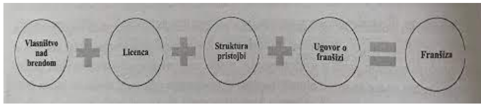
Slika 1. Osnovne karakteristike franšiznog sistema