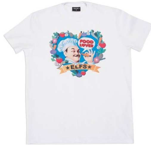
Slika 7. Suradnja ELFS-a i Podravke