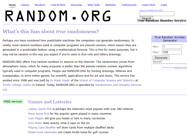
Slika 1. Primjer programa za generiranje slučajnog odabira random.org (Dostupno na: https://www.random.org , pristupljeno: 19. 9. 2022.)