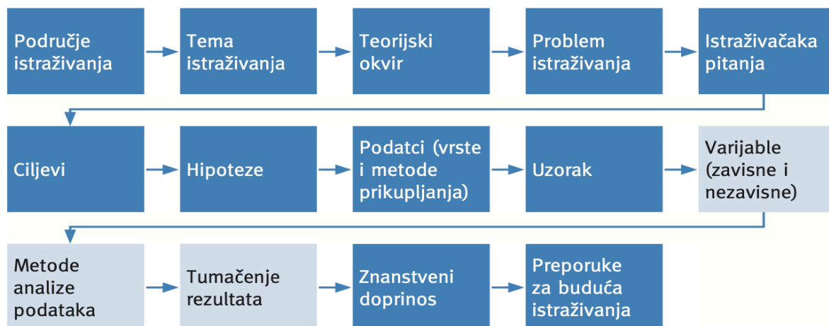
Slika 1: Istraživački proces

Uzorkovanje je dio kvantitativnog istraživačkog procesa (slika 1). „Istraživački proces temelji se na – prethodnim istraživanjima i izučavanju literature, odabiru metodologije istraživačkog rada, prikupljanju podataka i analizi podataka i tumačenju rezultata“ (Horvat i Mijoč, 2019:37). Uzorci se obično primjenjuju s namjerom kako bi se dobila slika o populaciji u cjelini, bez potrebe za promatranjem svakog člana te populacije.