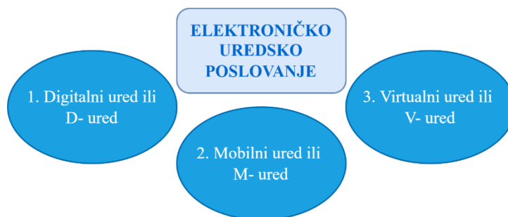
Slika 3: Elektroničko uredsko poslovanje

Globalizacije je dovela do „smanjenja svijeta“ zahvaljujući prometnom razvoju, ali i digitalnom napretku. Na takav način su poslovni partneri, kolege, suradnici postali bliži, nego što misle, a poslovna komunikacija je brza, jednostavna i inovativna. Tehnološki napredak neusporedivo je olakšao komunikaciju, dostupnost i razmjenu informacija te obavljanje gotovo svih poslovnih aktivnosti. Elektroničko uredsko poslovanje dijeli se na tri dijela prikazano na slici 3.