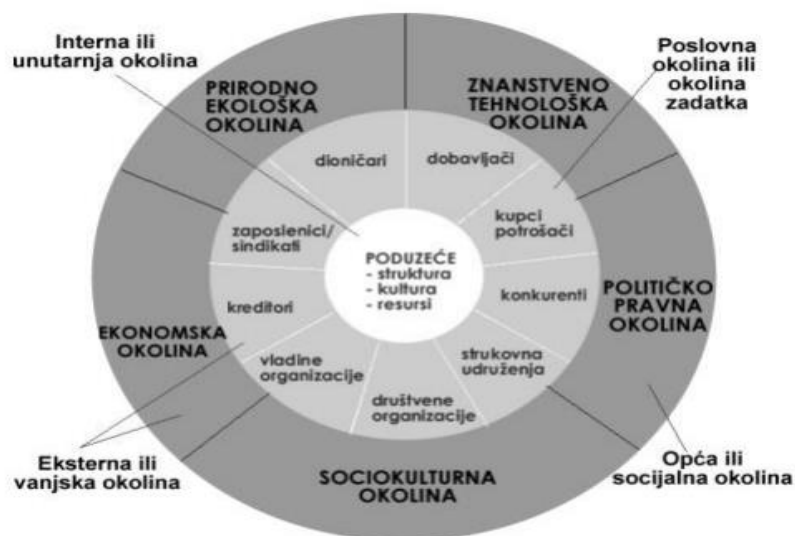
Slika 2: Analiza i elementi okoline

Okruženje poduzeća može utjecati direktno ili indirektno na njegovo poslovanje te može utjecati pozitivno ili negativno. Okolina je kompleksna i nepredvidiva i važno je proučavati i pratiti što se dešava u njoj te prepoznati prilike koje se nude ili pak opasnosti koje prijete poduzeću. Osnovna podjela okoline je na eksternu (vanjsku) i internu (unutarnju) okolinu. Na slici 2. prikazani su segmenti poslovnog okruženja i koje sve okoline postoje.