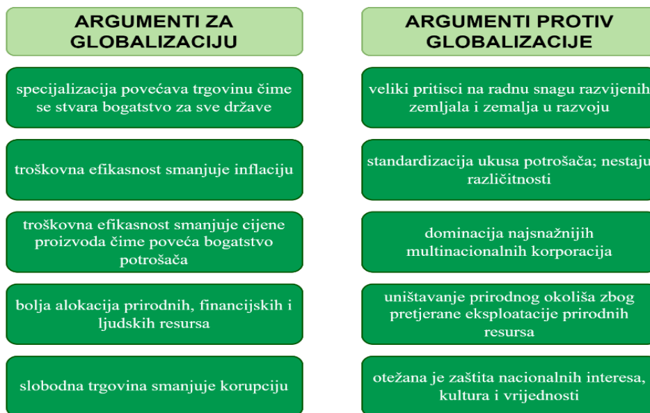
Slika 1: Društvene koristi od globalizacije

Globalizacija je proces kojeg je nemoguće zaustaviti, ali se neki segmenti i utjecaji mogu kontrolirati. Naime, proces je svojim širenjem i djelovanjem ostvario brojne prednosti, ali i nedostatke. I jedno i drugo može se sagledati iz mikroperspektive koja se odnosi na poslovanje i dublje istražuje pozitivne i negativne stvari i makroperspektive koja navodi općenite nedostatke i prednosti. Prednosti iz mikroperspektive koje opisuju Rahimić, Podrug (2013) su: troškovne prednosti (ostvaruju se standardizacijom proizvoda, odnosno poduzećima se postavljaju uvjeti po kojima moraju poslovati), vremenske prednosti (odnosi se na smanjenje vremena koje je neophodno za uvođenje proizvoda na tržište, a povećanje životnog ciklusa proizvoda), prednosti učenja (u međunarodnom poslovanju konstantno cirkuliraju informacije i razmjenjuje se postojeće znanje, a samim time dolazi se i do novih spoznaja i saznanja) i prednosti arbitraže (zbog slobodnog kretanja i obavljanja poslova u inozemstvu te širenja na globalno tržište, multinacionalne korporacije imaju mogućnost korištenja resursa u jednoj zemlji, a ostvarivanja dobiti i profita u drugoj zemlji). Prednosti i nedostaci koji su vidljivi iz makroperspektive prikazani su na slici 1.