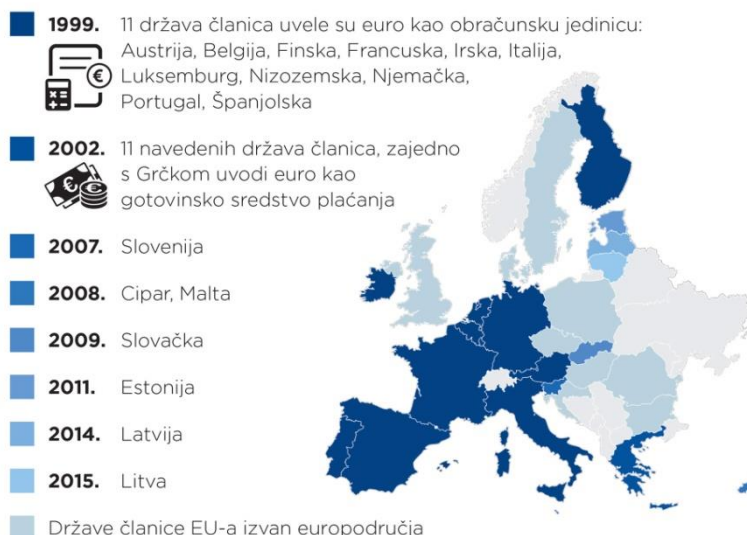
Slika 2. Širenje Europodručja