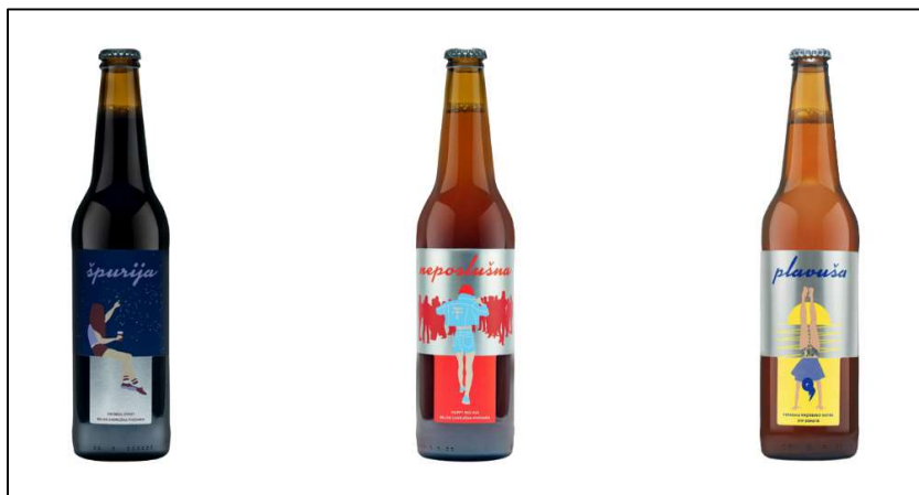
Slika 4 Stalni proizvodi Pivovare – piva Špurija, Neposlušna i Plavuša