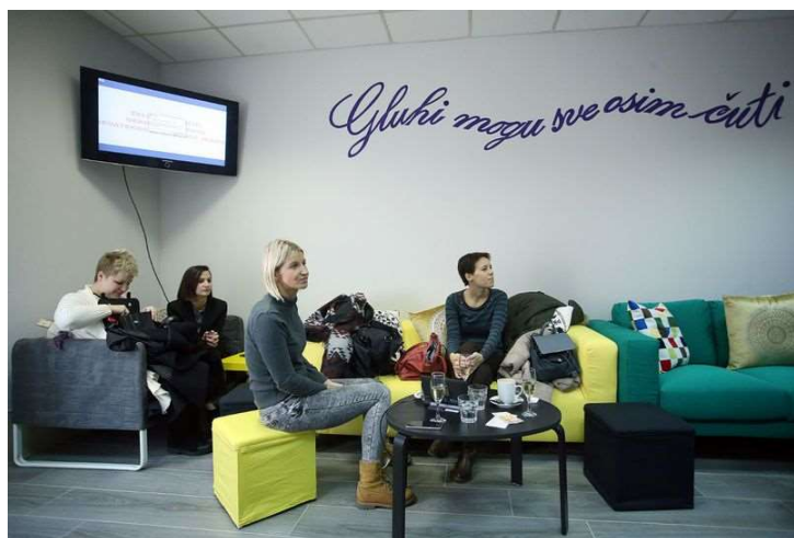
Slika 3 Interijer caffe bara Silent