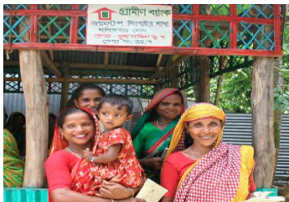
Slika 1 Klijentice Grameen banke ispred seoske poslovnice u Bangladešu