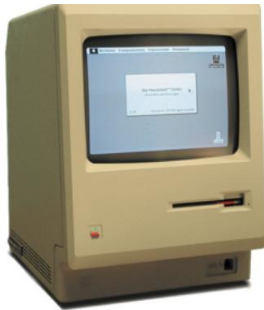
Slika 3: Prvo računalo Macintosh