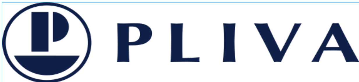
Slika 1 Logo poslovnog subjekta Plive

Pliva iza sebe ima više od čitavog stoljeća tradicije te uspješnog poslovanja. Danas je dijelom Teva grupe, jedne je od najvećih farmaceutskih kompanija svijeta. Djelatnosti koje se obavljaju u Plivi su proizvodnja gotovih lijekova, proizvodnja aktivnih farmaceutskih supstancija, prodajne i marketinške aktivnosti na hrvatskome tržištu te tržištima Jugoistočne Europe te istraživanja i razvoj lijekova te aktivnih farmaceutskih supstancija (Pliva.hr (a)). U nastavku slijedi logo Plive.