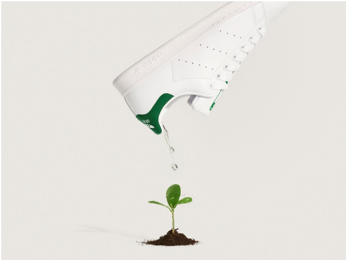
Slika 3. Vegan Adidas Stan Smith