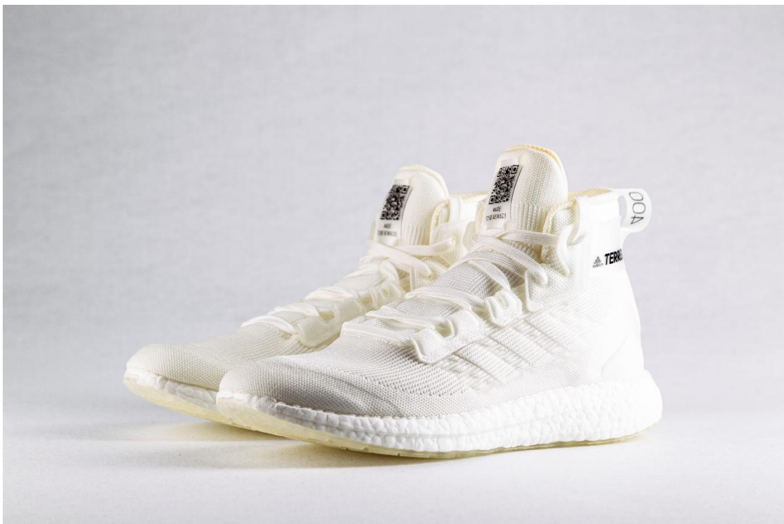
Slika 4. Freehiker tenisica – Made to be remade