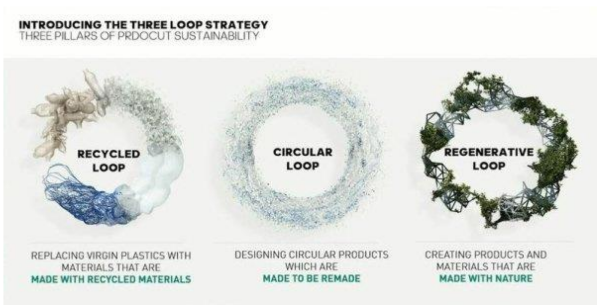
Slika 2. Three-Loop strategija

Slika u nastavku prikazuje navedenu strategiju.