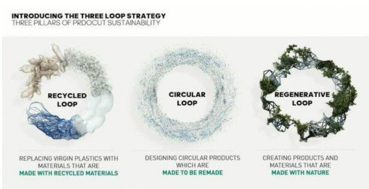
Slika 2. Three-Loop strategija

Slika u nastavku prikazuje navedenu strategiju.