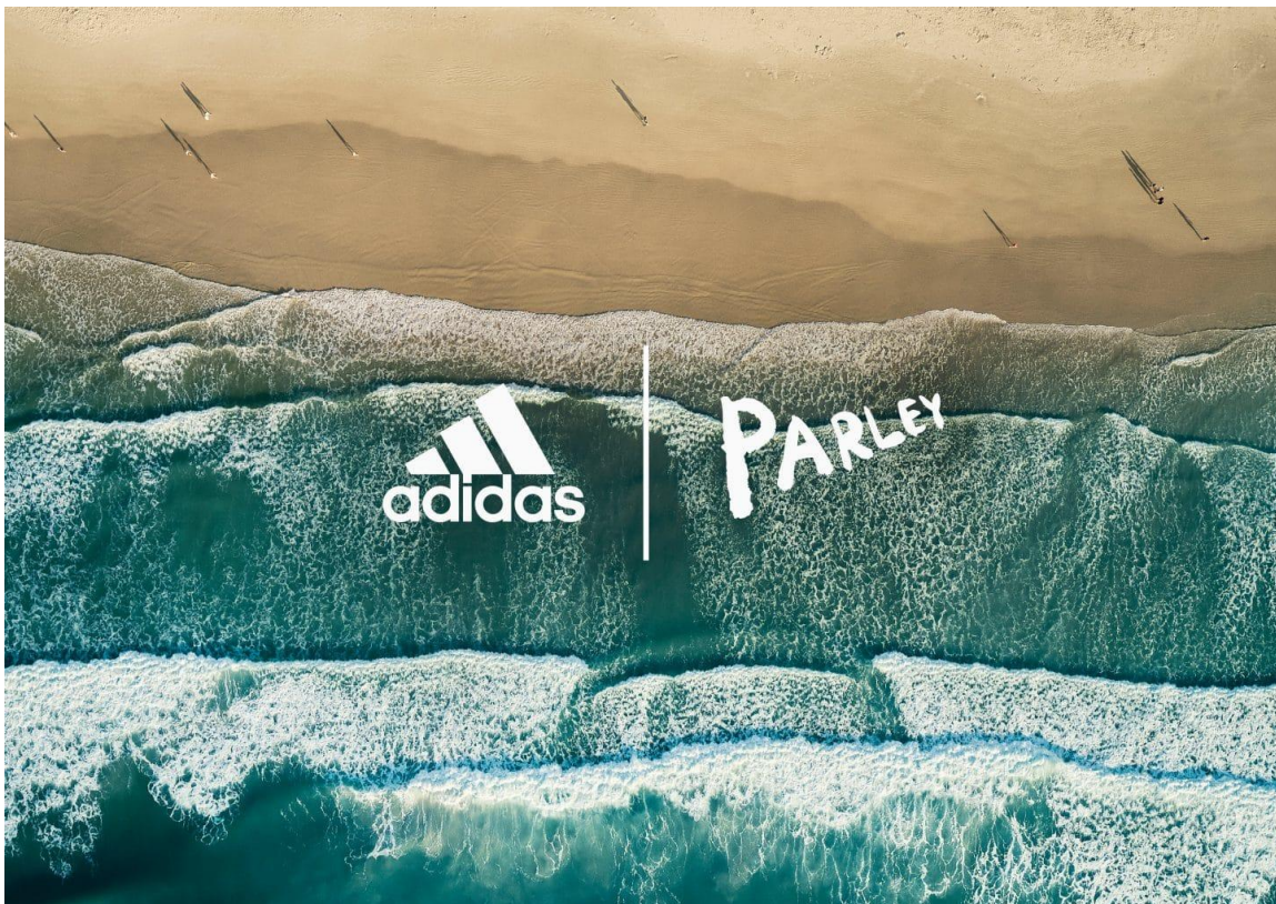
Slika 5. Adidas i Parley for the Oceans suradnja

Slika 5. prikazuje jednu od najpoznatijih Adidasovih suradnji, suradnja s Parley for the Oceans.