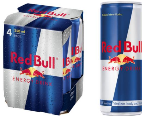
Slika 3. Pakovanje Red Bull-a

Proizvod se svojim dizajnom ambalaže razlikuje od konkurenta, prepoznatljive su boje na limenci plava, srebrna, font napisan crvenom bojom te dva crvena bika na prednjoj strani ambalaže prema kojima je i sama kompanija dobila ime.