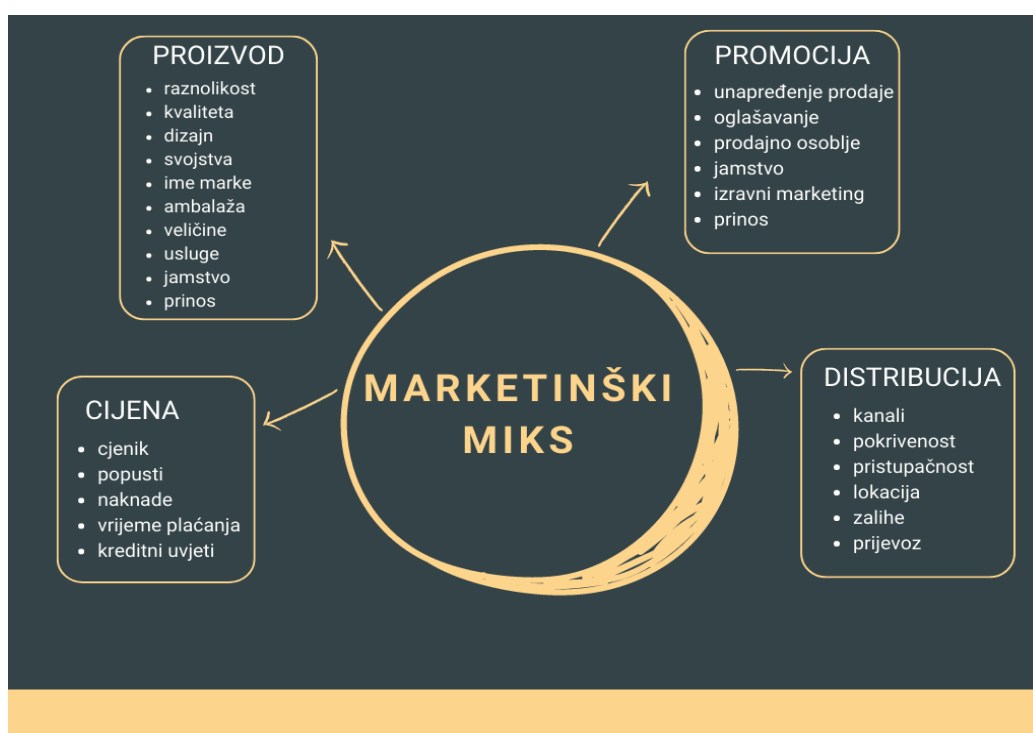
Slika 1. Četiri P - komponente marketinškog miksa

U ovom dijelu pojašnjava se teorijsko definiranje glavnog pojma rada i njegovih elemenata. Koncept marketinškog miksa ili četiri P predložio je i osmislio profesor marketinga Edmund Jerome McCarthy te ga je prvi put spomenuo u knjizi iz 1960. godine Basic Marketing: A Managerial Approach . Marketinški miks se također u raznim literaturama naziva i splet marketinga, „splet marketinga je skup taktičkih marketinških instrumenata kojima tvrtka upravlja i kombinira ih kako bi proizvela željenu reakciju na ciljnom tržištu“ (Kotler i dr., 2006:34). Naziv koji se često koristi za marketinški miks je 4P, slovo P označava početna slova svih četiri osnovna elementa koja se koriste u kombinaciji te svaki element mora biti usklađen sa svakim pojedinim elementom: product (proizvod), price (cijena), place (distribucija) i promotion (promocija).