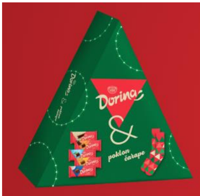
Slika 4. Dorina božićni paket