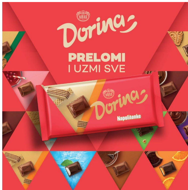
Slika 2. Dorina čokolade

Dorina čokolade od nedavno imaju i novu ambalažu. Dizajn ambalaže sada uključuje nova flowpack 1 pakiranja, a ona bolje zadržavaju svježinu i kvalitetu proizvoda. Kao što je prikazano na slici 2., vizual uključuje trokut u sredini kojem je cilj naglasiti okus pojedine čokolade, a omot čokolade je crvene boje.