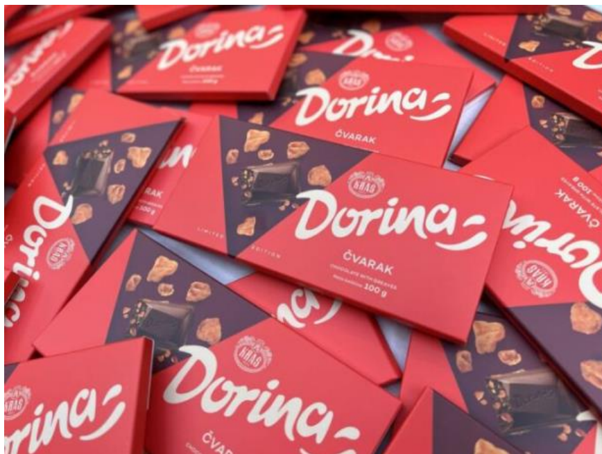
Slika 5. Dorina Čvarak

Izgled pakiranja Dorine Čvarak prikazan je na slici 6. Na slici je vidljivo kako je Kraš uložio trud u pakiranje Dorine Čvarak i prilagodio ju vizualnom identitetu ostalih Dorina čokolada.