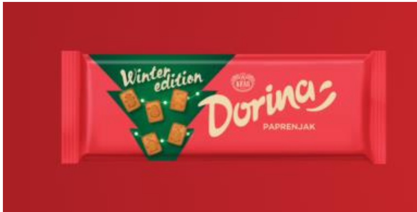
Slika 3. Božićno izdanje Dorina čokolade