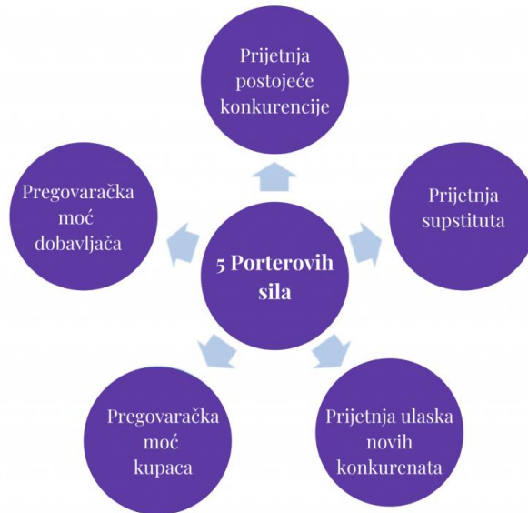
Slika 2 Porterov model pet konkurentskih snaga

industriji. Uz Greenov model se model pri analizi stanja industrije često koristi i Porterov model konkurentskih snaga, koji najčešće služi za procjenu atraktivnosti industrije u koju se planira ući pokretanjem novog poslovnog pothvata.