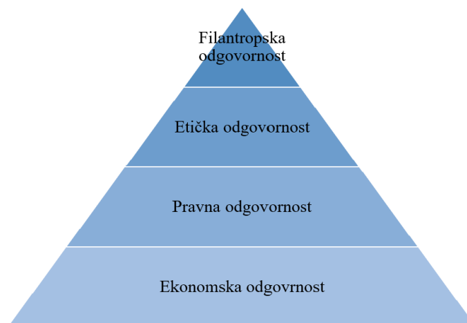
Slika 1: Piramida društveno odgovornog poslovanja