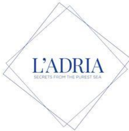
Slika 1: Logotip poslovnog subjekta L'Adria