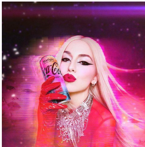
Slika 5. Ava Max Performance (Propaganda od the new Coca Cola drink). Dostupno na: https://www.youtube.com/watch?v=gwqCgUKNmfw [pristupljeno: 22.06.2023]

Prilikom promoviranja ograničenog izdanja, Coca – Cola omogućila je svim svojim kupcima koji kupe novu limenku kod koje je bilo potrebno skenirati te bi tako korisnici dobili pristup virtualnom koncertu u Metaverseu . U ovoj kampanji Coca – Cola je za virtualni koncert angažirala svjetski poznatu pjevačicu Avu Max.