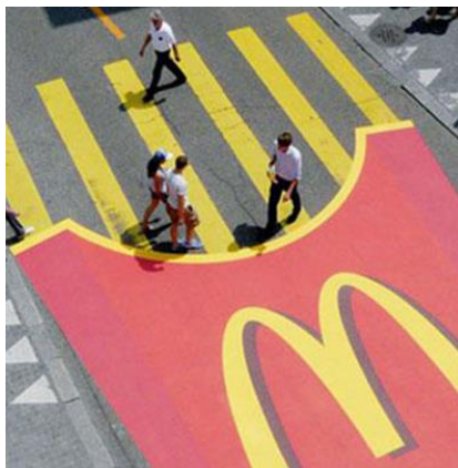
Slika 1. Prikaz Gerilla marketinga. Izvor: Poslovni plus. Dostupno na: https://poslovnipuls.com/2018/05/02/sto-je-to-guerilla-marketing/ [pristupljeno: 19. 06. 2023]