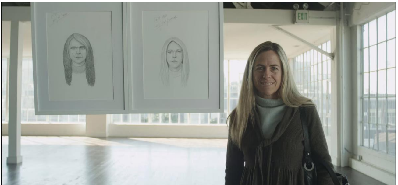
Slika 3. Dove Real Beauty Sketch, Dove campaigns.

Dove ima nekoliko viralnih kampanja koje su osmišljene tako da povećavaju samopouzdanje kod žena. Jedna od njihovih poznatijih kampanja, svakako je ona iz 2004. godine naziva Real Beauty Sketch čija je svrha bila dokazati ženama da su ljepše nego što misle.