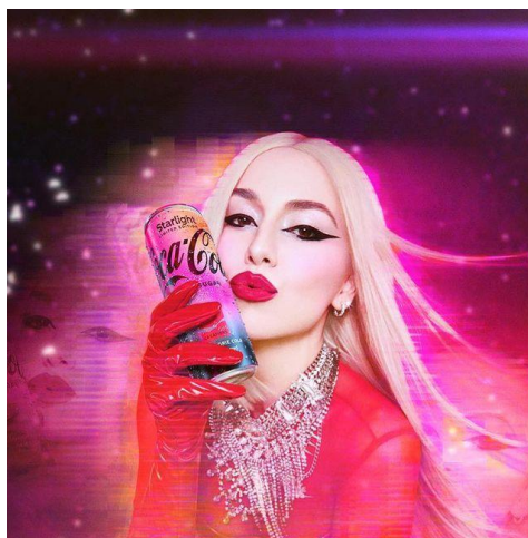
Slika 5. Ava Max Performance (Propaganda od the new Coca Cola drink).

Prilikom promoviranja ograničenog izdanja, Coca – Cola omogućila je svim svojim kupcima koji kupe novu limenku kod koje je bilo potrebno skenirati te bi tako korisnici dobili pristup virtualnom koncertu u Metaverseu . U ovoj kampanji Coca – Cola je za virtualni koncert angažirala svjetski poznatu pjevačicu Avu Max.