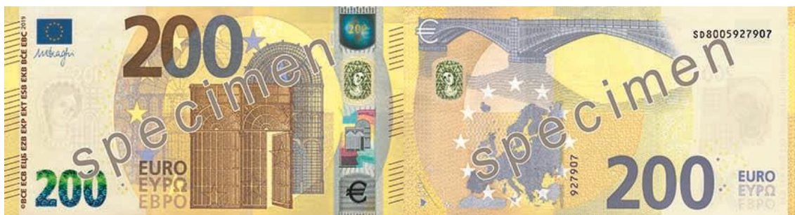
Slika 15 Novčanica od 200 €