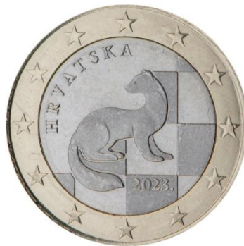
Slika 7 1 €, avers Republike Hrvatske.

Avers kovanice od 2 € dizajnirao je Ivan Šivak. Isti sadrži geografski prikaz Hrvatske na pozadini šahovnice koja zauzima gornju desnu polovicu unutarnjeg dijela zlatne boje, godinu izdavanja te natpis „HRVATSKA“ lučno napisan u donjem lijevom kutu. Rub kovanice također sadrži nacionalno obilježje, po čemu se razlikuje od ostalih denominacija. Riječ je o natpisu „O LIJEPA O DRAGA O SLATKA SLOBODO“ koji je stih iz drame autora Ivana Gundulića, „Dubravka“.