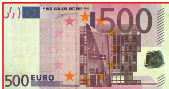
Slika 4 Krivotvorina „bin Ladenice“