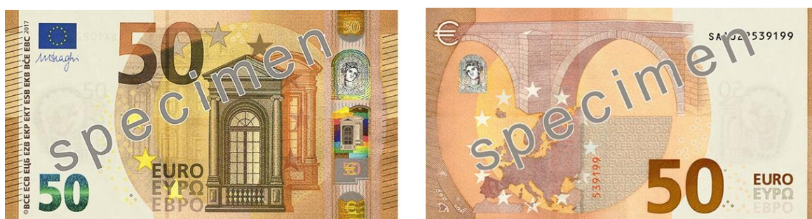
Slika 13 Novčanica od 50 €