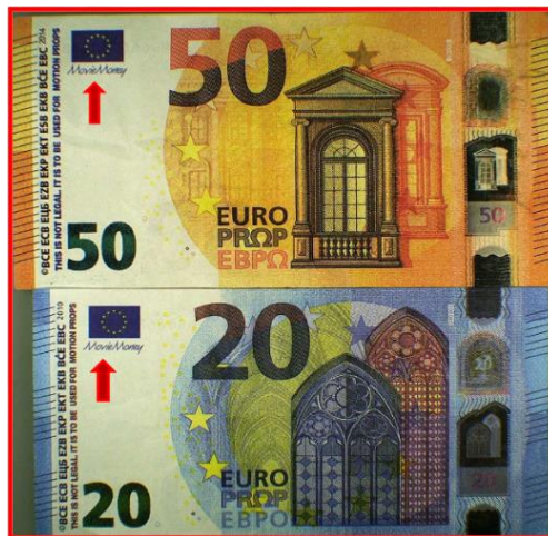
Slika 2 „Movie money“ novčanice od 50 € i 20 €.