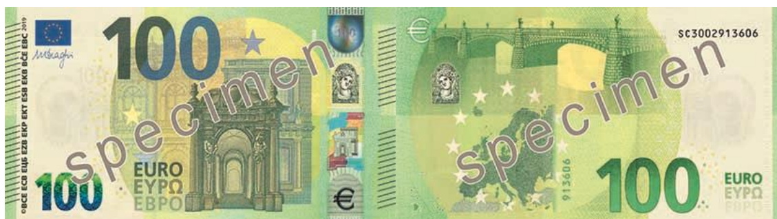
Slika 14 Novčanica od 100 €