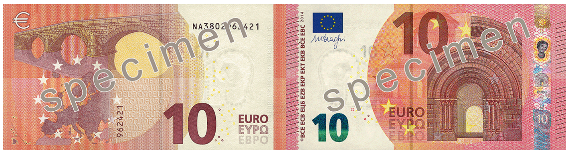
Slika 11 Novčanica od 10 €