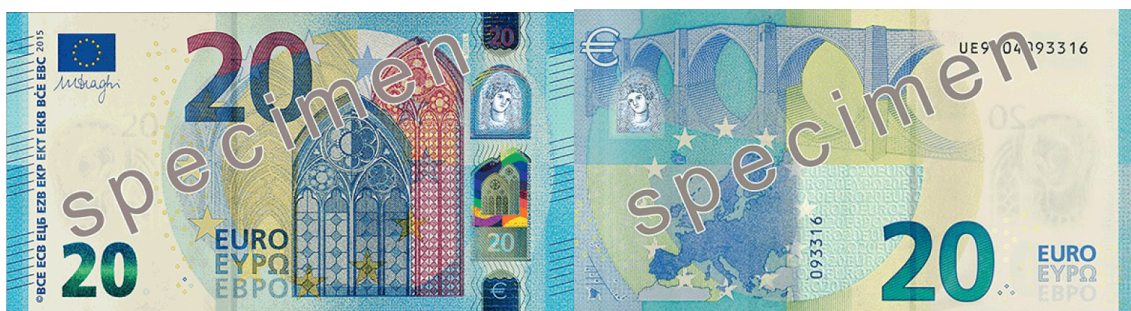
Slika 12 Novčanica od 20 €