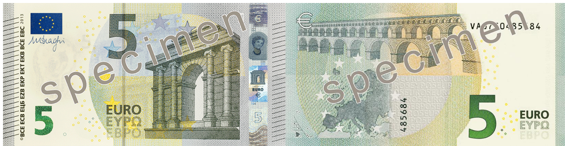
Slika 10 Novčanica od 5 €, ogledni primjerak

Seriya „Europa“ sastoji se od šest apoen: 5, 10, 20, 50, 100 i 200 eura. Razlika između te serije i prethodne je što ne sadrži apoen od 500 eura. Prema službenoj stranici Europske središnje banke, dizajni prikazuju arhitektonske stilove europske kulturne povijesti podijeljene na sedam razdoblja: klasično na 5 €, romaničko na 10 €, gotičko na 20 €, renesansa na 50 €, barok i rokoko na 100 €, doba željeza i stakla na 200 € te moderna arhitektura 20. stoljeća na 500 €. Sve novčanice prikazuju tipične elemente tih razdoblja, poput prozora, prolaza i mostova. Prozori i vrata na prednjoj strani simboliziraju europski duh otvorenosti i suradnje. 12 zvijezda EU predstavlja dinamiku i harmoniju suvremene Europe, dok mostovi na poleđini simboliziraju komunikaciju između građana Europe te između Europe i ostatka svijeta. Apoeni se također razlikuju u dimenzijama, te su manji apoeni usporedno manjih veličina.