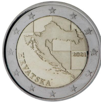
Slika 6 2 €, avers Republike Hrvatske.