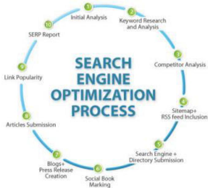
Slika 1 Proces optimizacije na tražilicama

proći prilikom optimizacije. Korisnicima je veoma bitno da prilikom pretraživanja do željenih rezultata dođu u što kraćem vremenu. Oko 80% korisnika interneta razne proizvode ili usluge traže upravo koristeći tražilice, a one same predstavljaju jednostavan i učinkovit način za reklamiranje tvrtke (Yalçın, N., Köse, U., 2010).