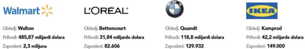
Slika 1. Najuspješnije obiteljske tvrtke svijeta