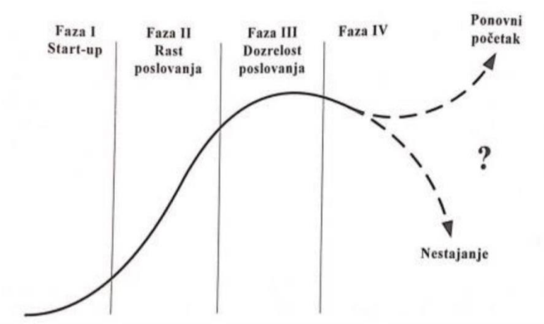
Slika 2. Faze životnog ciklusa obiteljskih poduzeća