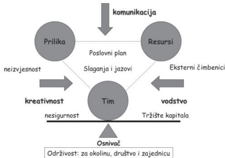
Slika 1. Timmonsov model poduzetničkog procesa

Izvor: Timmons J., New Venture Creation, Entrepreneurship for the 21st century, McGraw Hill, 2007