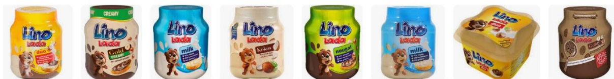
Slika 1. Asortiman proizvoda namaza Lino Lada