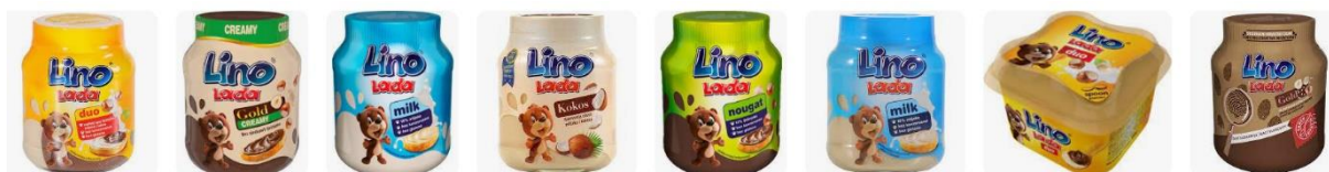
Slika 1. Asortiman proizvoda namaza Lino Lada