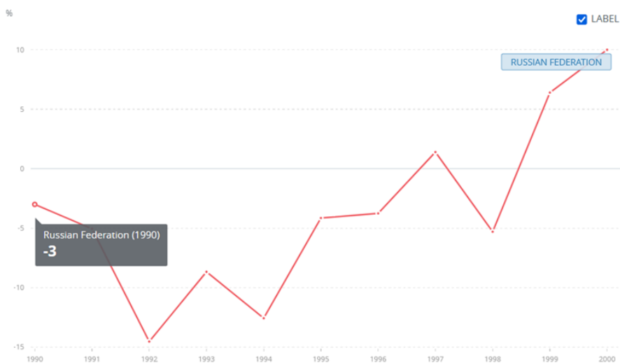
Slika 2: Prikaz stope rasta BDP-a u Rusiji 1990.g.

Povećana stopa nezaposlenosti predstavljala je izazov za rusko gospodarstvo i socijalnu stabilnost tijekom 1990-ih godina, a upravljanje tim pitanjem postalo je prioritet za vladu i političke dionike u to vrijeme. Valutna politika Rusije tijekom 1990-ih godina bila je obilježena nesigurnošću i fluktuacijama, posebno u pogledu vrijednosti ruske rublje. Kao što je McDonald's ulazio na rusko tržište u to vrijeme, valutna politika je imala značajan utjecaj na njegovo poslovanje i financijske operacije. Nakon raspada Sovjetskog Saveza, Rusija je suočena s monetarnom nestabilnošću i slabostima u vođenju monetarne politike. Devalvacija rublje i gubitak vrijednosti bili su karakteristični za taj period. Uzrok tome su bili monetarni faktori poput velikih državnih subvencija, monetarne ekspanzije i monetizacije proračunskog deficita.