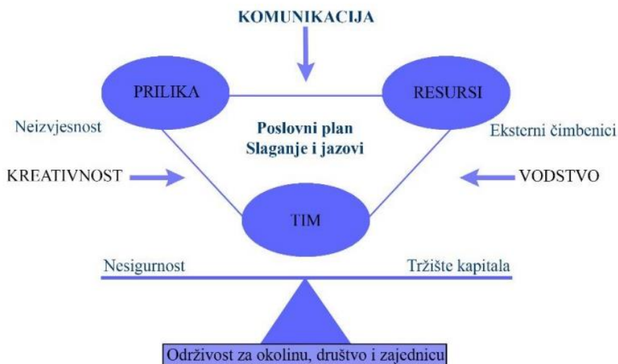
Slika 1 Timmonsov model poduzetničkog procesa (izvor: Timmons i Spinelli, 2003)

pokretanja poslovnog pothvata smanjuje početni rizik i osigurava konkurentsku prednost (Timmons i Spinelli, 2003).