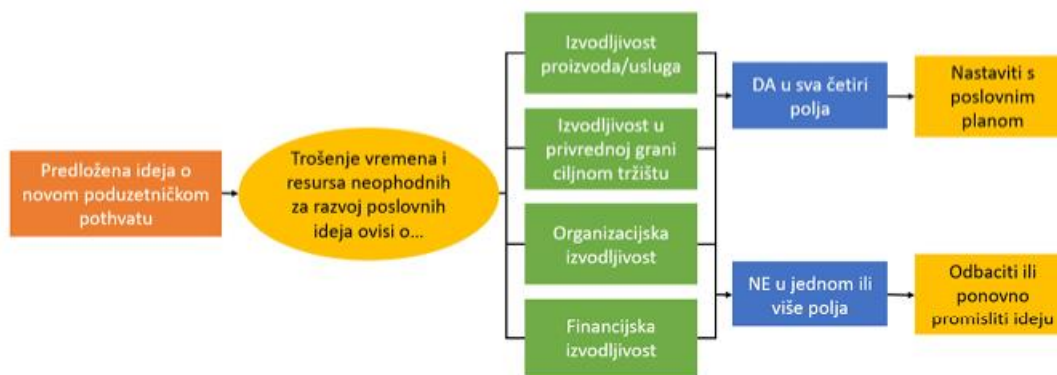
Slika 3 Uloga analiza izvedivosti u razvoju uspješne poslovne ideje

U razvoju uspješne poslovne ideje, bitnu ulogu ima analiza izvedivosti. Analiza izvedivosti (engl. feasibility study ) faza je u poduzetničkom procesu, prije pisanja poslovnog pothvata. To je zapravo proces kojim se utvrđuje je li poslovna ideja izvodljiva, svojevrsna revizija. Vrednuje se poslovni pothvat, ne sama ideja. Na taj se način poduzetnici potiču da izbjegnu o svojoj poslovnoj ideji razmišljati kao o čudesnoj te da ne budu zaslijepljeni vlastitim oduševljenjem idejom. Kraće rečeno, analiza izvedivosti je testiranje ideje. Kada se provodi analiza izvedivosti, na poslovnu ideju ne treba gledati kao na ideju, već o njoj razmišljati kao o pothvatu. Analiza izvedivosti je u biti više vrednovanje potencijalnog pothvata, a ne samog proizvoda ili usluge.