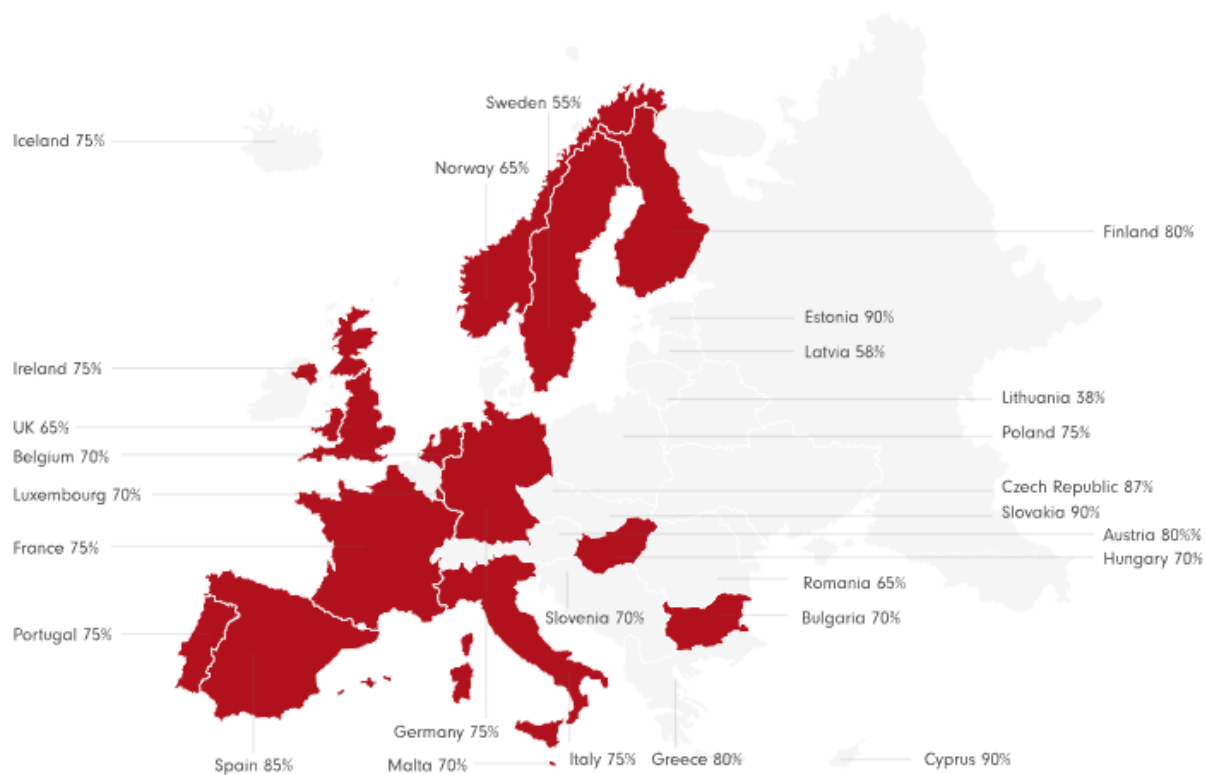
Slika 1. Rasprostranjenost obiteljskih poduzeća diljem Europe: postotak obiteljskih poduzeća u odnosu na ukupan broj poduzeća