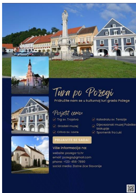
Slika 5. Primjer plakata za kulturne ture