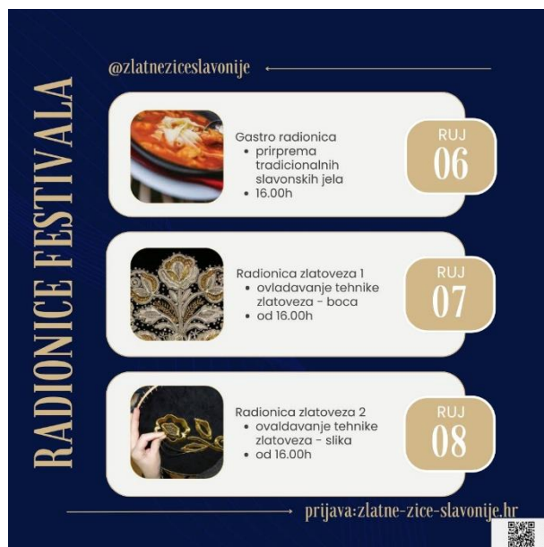
Slika 4. Primjer plakata za radionice