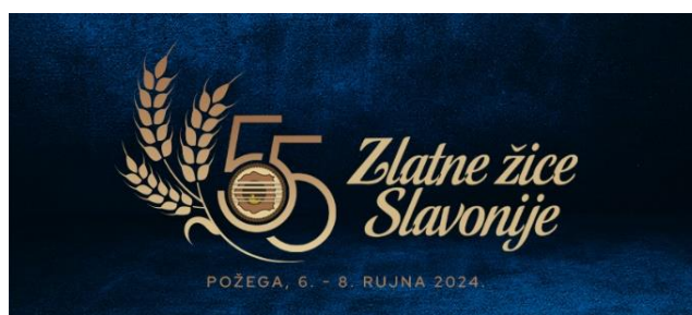
Slika 2. Primjer vizuala

Vizuali koji se koriste u promociji festivala ističu se tradicionalnim motivima slavonskog folkloru, uz korištenje karakteristične plave boje. Korištenje lokalnih motiva u kombinaciji s modernim dizajnom omogućava festivalu da ostane privlačan i za mlađu publiku. Dizajn plakata i banneru u skladu je s brendom festivala, a svi promotivni materijali uključuju prepoznatljiv logo festivala. Ove godine vizualima dominira broj 55 s obzirom da se obilježava 55. godina od prvog izdanja festivala.