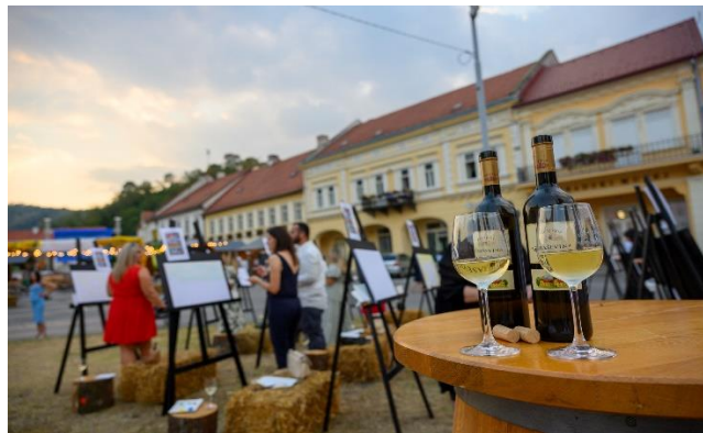
Slika 3. „WINE&paint“ radionica

Uz sve nastupe, festival se također ističe i s gastro ponudom bogate slavonske kuhinje. Posjetitelji mogu uživati u tradicionalnim jelima poput kulena, slavonskih kobasica i domaćih kolača. Posebno su popularne lokalne vinoteke koje predstavljaju autohtone proizvode Slavonije. Osim gastro ponude, festival uključuje i brojne dodatne aktivnosti koje doprinose bogatstvu programa. U sklopu festivala održava se festivalski sajam na kojemu posjetitelji mogu kupiti ručno rađene proizvode, poput slika, proizvoda od drveta, prirodne kozmetike, ukrasa i ostalih proizvoda. Također organiziraju se različite radionice za djecu, natjecanje u pjevanju za djecu pod nazivom „Zlatni mikrofon“, izložbe u muzeju i ostale aktivnosti. Jedna od popularnijih aktivnost je „WINE&paint“, radionica slikanja na platnu na kojoj posjetitelji uživaju u slikanju uz čašu dobrog vina.