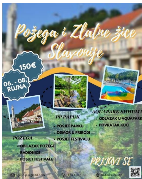
Slika 6. Primjer plakata za putovanje