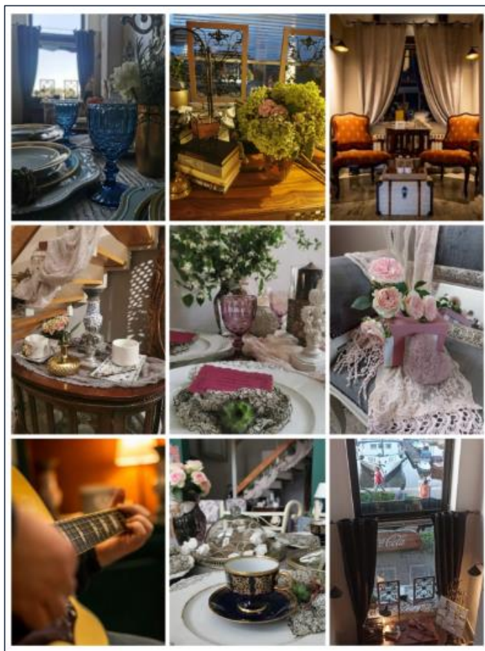
Slika 3 Studio Respect

pozitivnom energijom i inspiracijom. Međutim poduzetnici je bilo potrebno oko godinu i pol dana od ideje do realizacije svog poslovnog pothvata. Paralelno s radom u školi planirala je poslovni pothvat. Nakon što je dala otkaz u školi, otvorila je svoj obrt i započela sa davanjem usluga instrukcija iz engleskog jezika i tematskih večeri slikanja, koje se kasnije razvilo u „Feel Good and Paint“ radionicu. Nakon toga su došli drugi autorski programi i rođendaonice. Svoj poslovni pothvat financirala je iz vlastite uštedevine i iz potpore za samozapošljavanje Hrvatskog zavoda za zapošljavanje (HZZ).