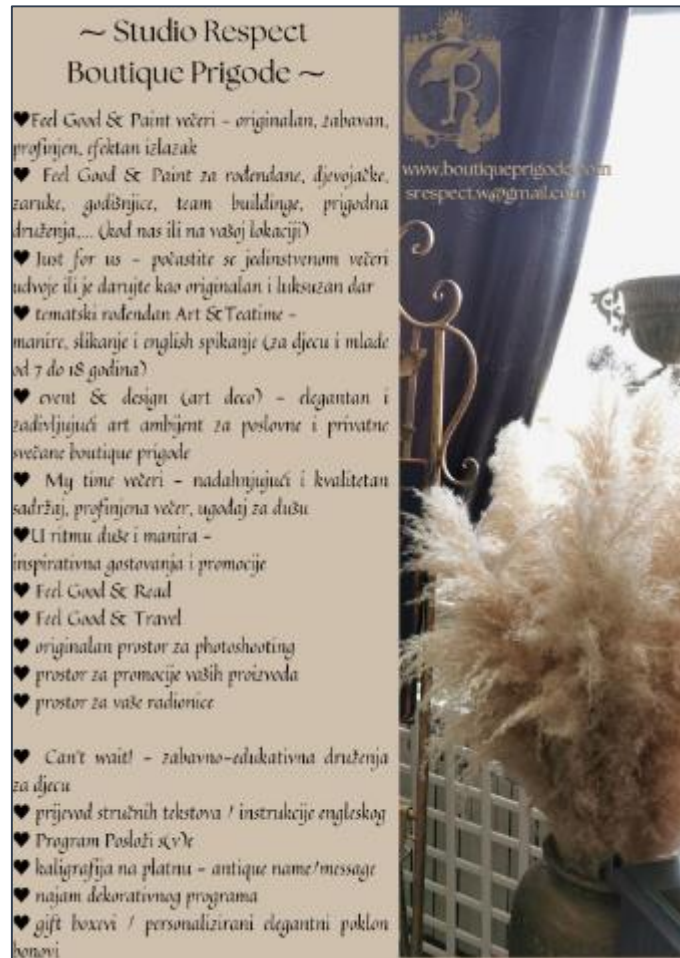
Slika 4 Usluge i proizvodi

programima, ali i po svom dizajnu i konceptu. Ono što ga čini posebnim jesu detalji i antikviteti. Studio odiše elegancijom i nekim drugim vremenom.