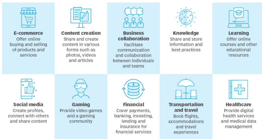
Slika 1. Vrste digitalnih platformi