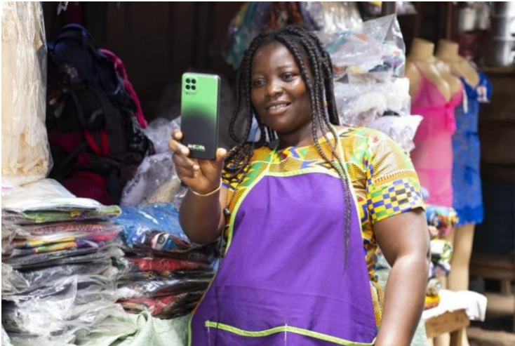
Slika 3: M-Kopa mobilni uređaj