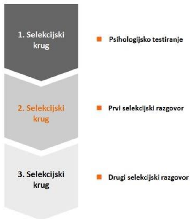
Slika 2 Krugovi selekcijskog postupka