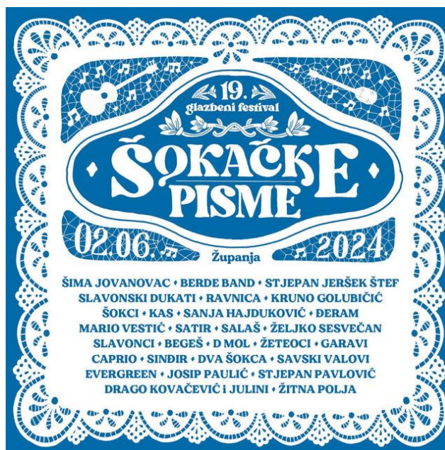
Slika 4. Popis izvođača na 19. festivalu Šokačke pisme u Županji

tamburaške glazbe. Na festivalu uz manje poznate (lokalne) sastave, sudjeluju i najpopularniji izvođači šokačke glazbe. Neki od njih su Stjepan Jeršek Štef, Šima Jovanovac i Mario Vestić. Popis izvođača 19. izdanja Festivala prikazan je promotivnim materijalom i vizualnim identitetom događanja (Slika 4).