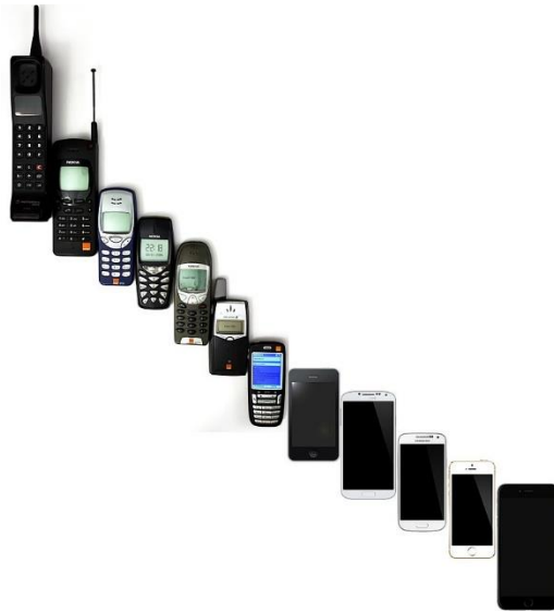
Slika 3., Evolucija mobilnih telefona od 1992. do 2014. godine