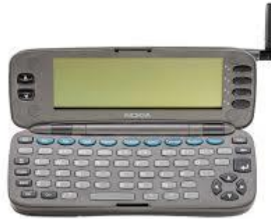
Slika 2., Nokia 9000 Communicator

Nakon Motorole veliki zaokret donosi smartphone serija Nokia 9000 Communicator. Ovo je prvi smartphone na tržištu i predstavljen je 1996. godine. Izgled ovog smartphonea može se vidjeti na slici 2.