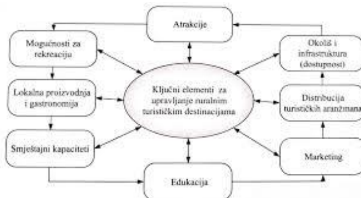
Slika 1. Ključni elementi za upravljanje ruralnom turističkom destinacijom