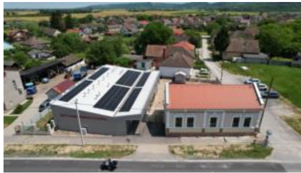
Slika 5. Prikaz Kuće Baranjskog kulena