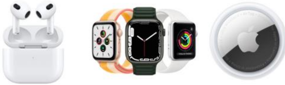
Slika 3: Apple AirPods, Apple Watch, Apple AirTag (Apple, 2024)