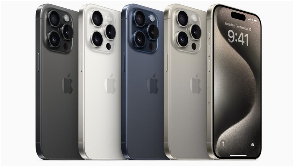
Slika 1: iPhone 15 linija (Apple, 2024)

iPhone 15 nudi najnapredniji hardver koji sadrži novi A17 čip, tijelo izrađeno od titanija, grafički čip sa šest jezgri, 48 MP kameru, osvježanje zaslona od 120 Hz po sekundi i interni strukturalni okvir od 100 % recikliranog aluminija (Apple, 2024). Apple se trudi svoju ambalažu i cjelokupni proces distribucije i prodaje proizvoda učiniti što zelenijim stoga su prije nekoliko godina prestali uključivati dodatke poput slušalica i adaptera punjača u ambalaži iPhone-a. Kao i mnoga poduzeća orijentacija na zelenije poslovanje pomaže im zainteresirati potencijalne potrošače kojima je stalo do ekološke osviještenosti brendova od kojih kupuju. Posebnost iPhone uređaja, ali i ostalih uređaja drugih linija, je što ih pokreće originalni Appleov softver, a u slučaju iPhone-a to je iOS sustav. S obzirom na to da Apple posjeduje puno pravo na taj sustav niti jedan konkurentski proizvod ne može koristiti isti, što Appleu daje konkurentsku prednost i osigurava jedinstvenost.