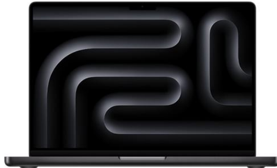
Slika 2: MacBook Pro M3 (Apple, 2024)

računalo s najboljim zaslonom ikada na prijenosnom računalu, baterijom koja može izdržati do dvadeset i dva sata konstantne upotrebe i 80 % bržim CPU-om. Apple svake godine diferencira proizvode u smislu dostupnih specifikacija, pa je tako i prošle godine prezentirao potrošačima tri moguća izbora, M3 procesor, M3 Pro ili M3 Max čip. Tako osiguravaju cjenovnu pristupačnost za svaki segment tržišta, ali i za korisnike kojima možda nije potrebno najjače računalo po najvišoj cijeni.