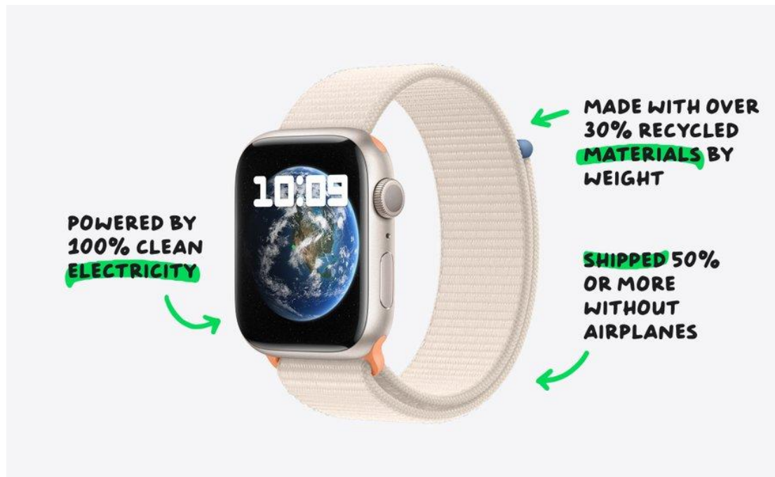
Slika 4: Apple Watch 9 (Tim Cook, X, 2023)

promocijske strategije. Suradnje s poznatim pjevačima poput Drakea i Taylor Swift, koji je promovirao Apple Music, pozitivno su se odrazile na poslovanje poduzeća.