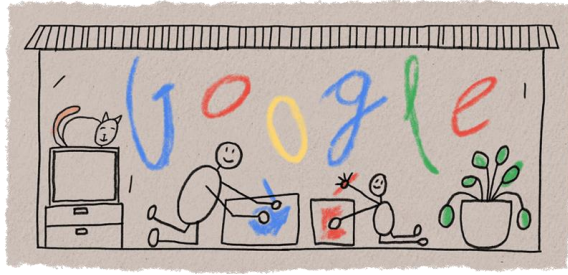
Slika 1. Primjer nestrukturiranih podataka