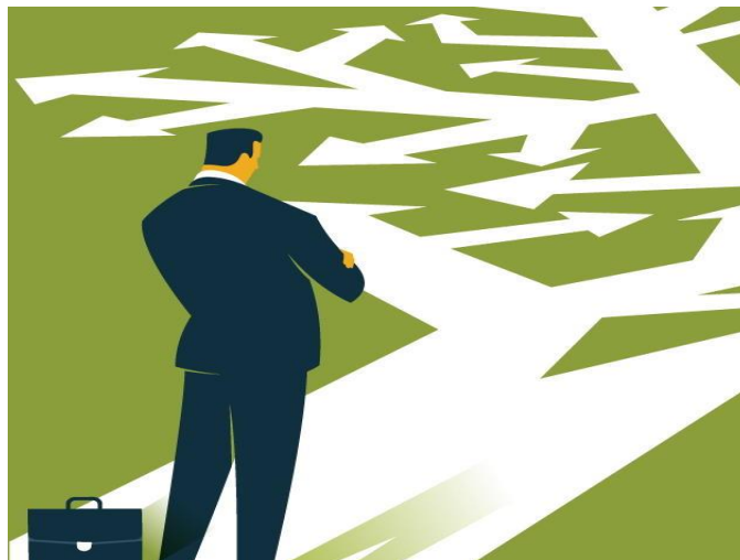
Slika 6. Donošenje odluka

Deskriptivni pristup odnosi se na opisivanje stvarnog ponašanja i odluka koje su donesene u etičkim situacijama. Temelji se na istraživanjima, na koji način i što utječe da pojedinac donese određenu odluku. Proces moralnog djelovanja uključuje moralnu svjesnost koja je prvi korak u donošenju etičke odluke, te da bi pojedinac znao prepoznati etičku dvojbu mora posjedovati moralnu svjesnost. Moralna prosudba odnosi se na prosuđivanje što je dobro, ali ne znači nužno da će ta odluka koja je dobra i provesti. Brojni faktori mogu utjecati na to da se etičke odluke ne provedu.