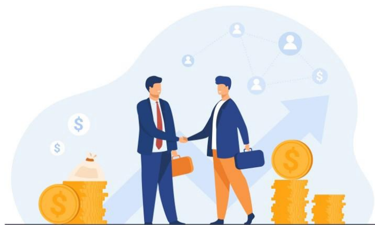
Slika 3. Outsourcing

Prema istraživanja istog portala jedan od nedostataka je da tvrtka koju poduzeće unajmi pruža usluge i konkurentima pa se na taj način gubi povjerenje, ali i konkurentska prednost. Cijena pružanja usluge može biti u međuvremenu promijenjena što znatno utječe na financije poduzeća koje unajmljuje. Na temelju sve veće zastupljenosti tehnologije i online načina komuniciranja, može doći do problema i s izravnom komunikacijom između davatelja i pružatelja usluge, jer izostaje upravo taj fizički kontakt. Ljudi su živa bića i komunikacija je osnova na temelju koje se sve zasniva, niti jedan oblik komunikacije nikada neće moći zamijeniti onaj osnovni i glavni oblik, odnosno komunikaciju licem u lice. Nezadovoljstvu korisnika mogu pridonijeti neočekivani problemi poput kvalitete ispunjenja usluge. Davatelj usluge možda neće ispuniti zadatak u onom razmjeru kvalitete koju je naručitelj to tražio i na taj način se mogu stvoriti problemi u poslovanju. Jednako tako bitan nedostatak je izostanak kontrole poduzeća koje je unajmilo specijaliziranu tvrtku da provede zadatak.