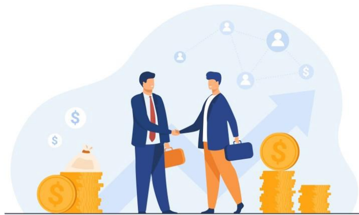
Slika 3. Outsourcing

Prema istraživanja istog portala jedan od nedostataka je da tvrtka koju poduzeće unajmi pruža usluge i konkurentima pa se na taj način gubi povjerenje, ali i konkurentska prednost. Cijena pružanja usluge može biti u međuvremenu promijenjena što znatno utječe na financije poduzeća koje unajmljuje. Na temelju sve veće zastupljenosti tehnologije i online načina komuniciranja, može doći do problema i s izravnom komunikacijom između davatelja i pružatelja usluge, jer izostaje upravo taj fizički kontakt. Ljudi su živa bića i komunikacija je osnova na temelju koje se sve zasniva, niti jedan oblik komunikacije nikada neće moći zamijeniti onaj osnovni i glavni oblik, odnosno komunikaciju licem u lice. Nezadovoljstvu korisnika mogu pridonijeti neočekivani problemi poput kvalitete ispunjenja usluge. Davatelj usluge možda neće ispuniti zadatak u onom razmjeru kvalitete koju je naručitelj to tražio i na taj način se mogu stvoriti problemi u poslovanju. Jednako tako bitan nedostatak je izostanak kontrole poduzeća koje je unajmilo specijaliziranu tvrtku da provede zadatak.