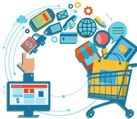
Slika 2. E – trgovina

Postoji osnovna razlika između e – poslovanja i e – trgovine, a to je da je e – trgovina puno uži pojam od elektroničkog poslovanja. E – trgovina uključuje obavljanje svih transakcija kupnje i prodaje. (Pantheon, 2018.) Sklapanje ugovora između prodavatelja i kupca odvija bez fizičkog kontakta. Kao za sve tako i za e – trgovinu postoje brojne prednosti ali i nedostaci.