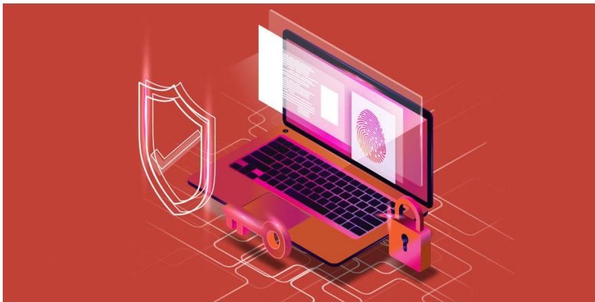
Slika 5. Zaštita podataka

Kompanijama često nedostaje stručnog osoblja koje se bavi sigurnosnom zaštitom unutar tvrtke. Još jedna stvar koja ograničava tvrtke je novac kojeg nemaju dovoljno ako požele obrazovati pojedine djelatnike koji bi radili u tom području. Nažalost, ovakvih napada bi moglo biti sve više i zbog toga je važno educirati djelatnike kako izbjeći napade i kako se zaštititi.