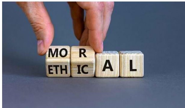
Slika 4. Moral i etika

Ljudi često poistovjećuju pojam etike i morala iako postoji razlika između ta dva pojma. Etika dolazi od grčke riječi ethos , što znači običaj. „Etika je društvena znanost koja istražuje moral, moralne vrijednosti i kriterije.“ (Bosilj -Vukšić, 2020:287) Etika, dakle proučava ljudsko ponašanje i postavlja određena očekivanja, kako bi se pojedinac trebao ponašati. Pojedinac sam odabire hoće li se ponašati etično ili ne. Primjeri etičnog ponašanja su iskrenost, odanost i pošteno ponašanje. Etika upućuje na postojanje drugih ljudi i na njihove potrebe i očekivanja. Etično se češće veže uz poslovno, dok se moralno češće veže uz osobno ponašanje pojedinca.