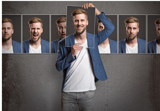
Slika 7. Osobnost ili ličnost

Individualne karakteristike su osobine pojedinca koje utječu na donošenje odluke, također one tvore ličnost osobe. Ličnost određuje pojedinca, njegovo ponašanje, može se reći da je to ukupnost čovjekovih psiholoških karakteristika. (Hrvatska enciklopedija, 2024.) Općeprihvaćeni model podjele tipova ličnosti naziva se velikih pet, a to su ekstraverzija ili introverzija, ugodnost, savjesnost, neurotizam ili emocionalna stabilnost i otvorenost prema iskustvu.