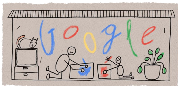
Slika 1. Primjer nestrukturiranih podataka