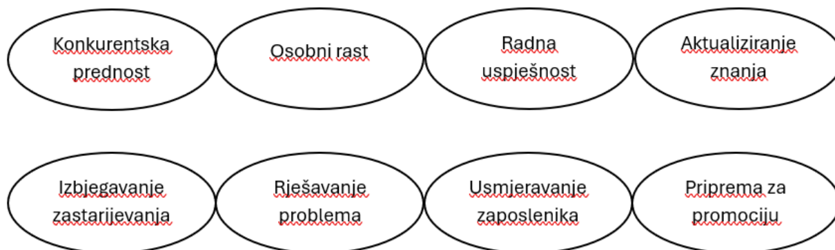
Slika 1. Ciljevi obrazovanja

Kroz obrazovanje i razvoj svojih zaposlenika poduzeće može smanjiti troškove, stvoriti veću vrijednost, povećati fleksibilnost te unaprijediti svoju konkurentnost. Obrazovanje zaposlenika ključno je za povećanje konkurentne prednosti i osiguravanje opstanka na tržištu, dok pojedincima omogućuje veći uspjeh u poslu i poboljšava njihovu "zaposlenost". Osim povećanja konkurentne prednosti i zadovoljavanja osobnih potreba rasta, u nastavku slika 1 prikazuje ostale opće ciljeve prema kojima je obrazovanje orijentirano.