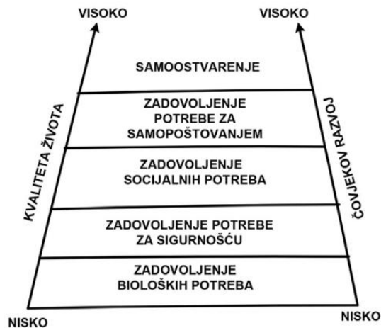
Slika 2. Cjeloviti razvoj i kvaliteta života

Zaključno, Sirgy, (1986) navedeno u Pastuović (2016), smatra da se svrha obrazovanja definira se kao doprinos poboljšanju kvalitete života. Iz slike 2 može se zaključiti da je razvijena ona zemlja čiji stanovnici zadovoljavaju potrebe višeg reda (samoostvarujuće i socijalne), dok su manje razvijene zemlje one gdje se većina ljudi fokusira na zadovoljenje potreba nižeg reda (bioloških i sigurnosnih). U konačnici, razvijenost društva, mjeri se zadovoljstvom članova jer je zadovoljstvo životom pokazatelj kvalitete društva.