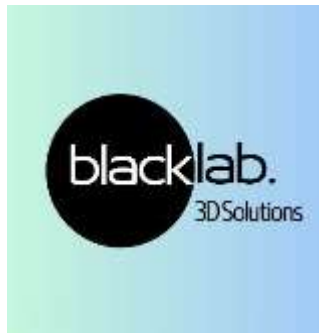
Slika 1. Logotip poduzeća Black Lab 3D Solutions

na proizvodnju prilagođenih dijelova napravljenih pomoću tehnologije 3D ispisa. Slika 1. prikazuje logotip poduzeća Black Lab 3D Solutions, kreiran od strane autora.