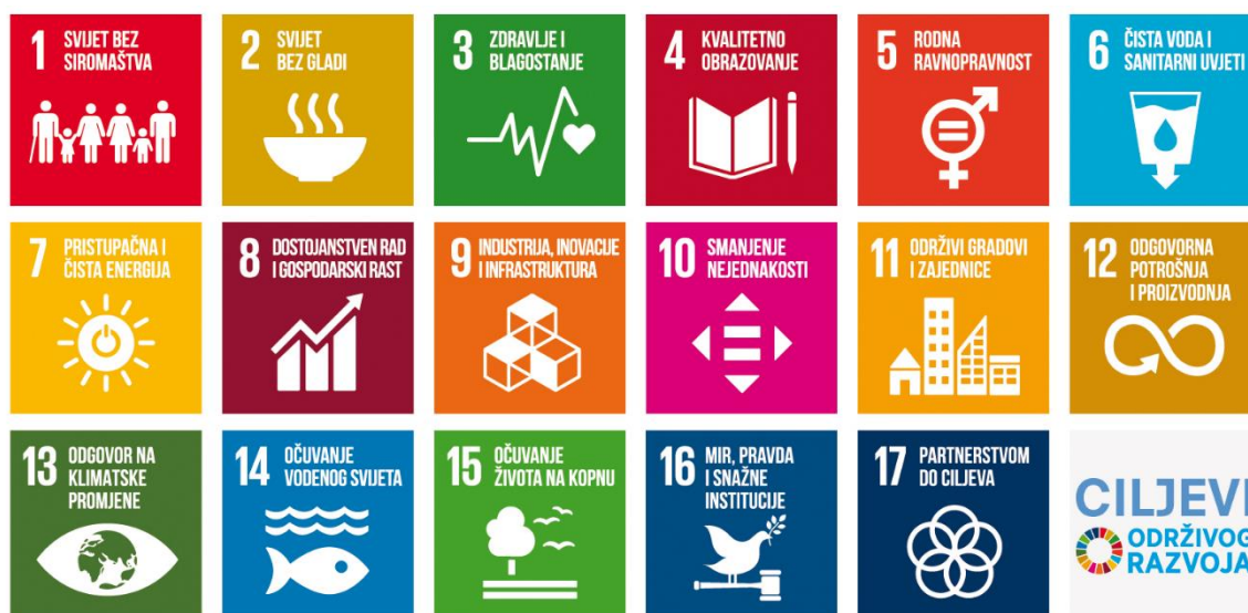
Slika 1. Ciljevi održivog razvoja prema UN-u