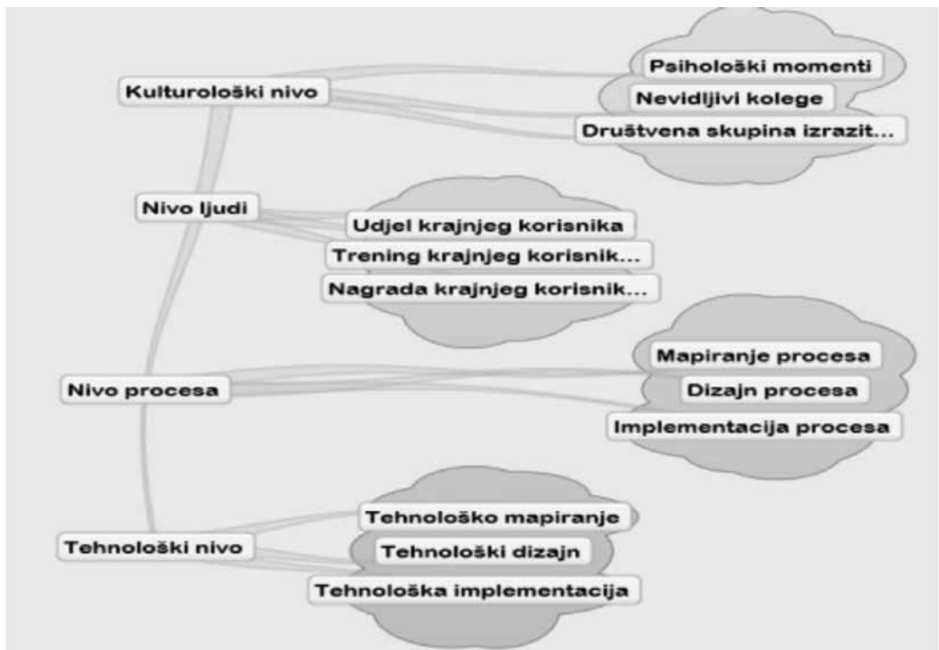
Slika 3. Višerazinski pristup implementaciji strategije upravljanja odnosima s klijentima prema Finneganu te Currieu