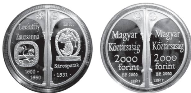
Slika 1. 2000 forinti + 2000 forinti, 2000. godina, avers i revers