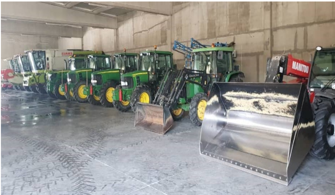
Slika 2. Poljoprivredni strojevi u OPG-u Zečević