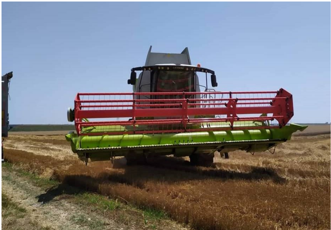
Slika 1. Kombajn u žetvi