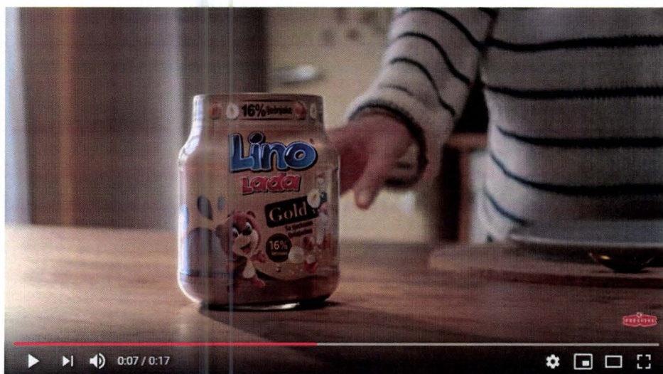
Lino lada - Razmaži me sada