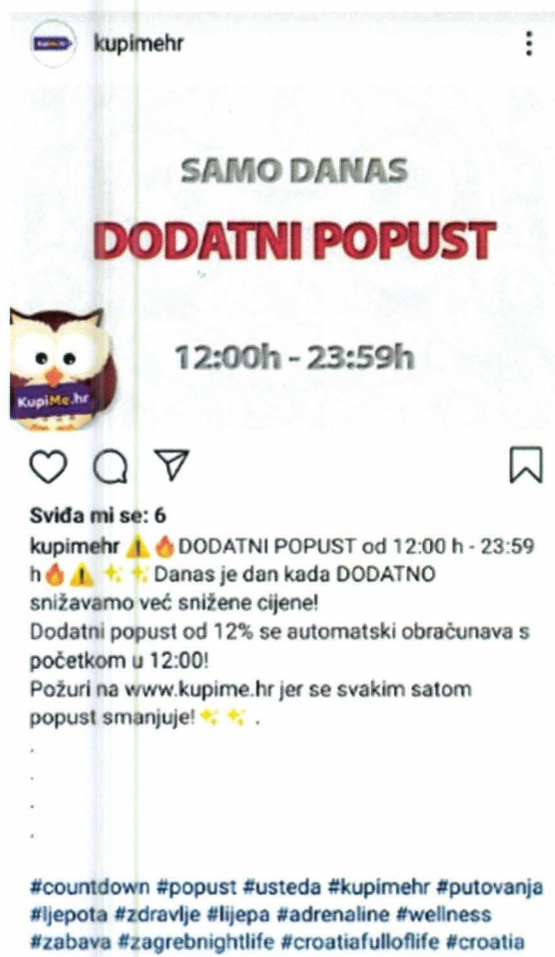
Slika 3. Oglas na Instagramu agencije KupiMe.hr