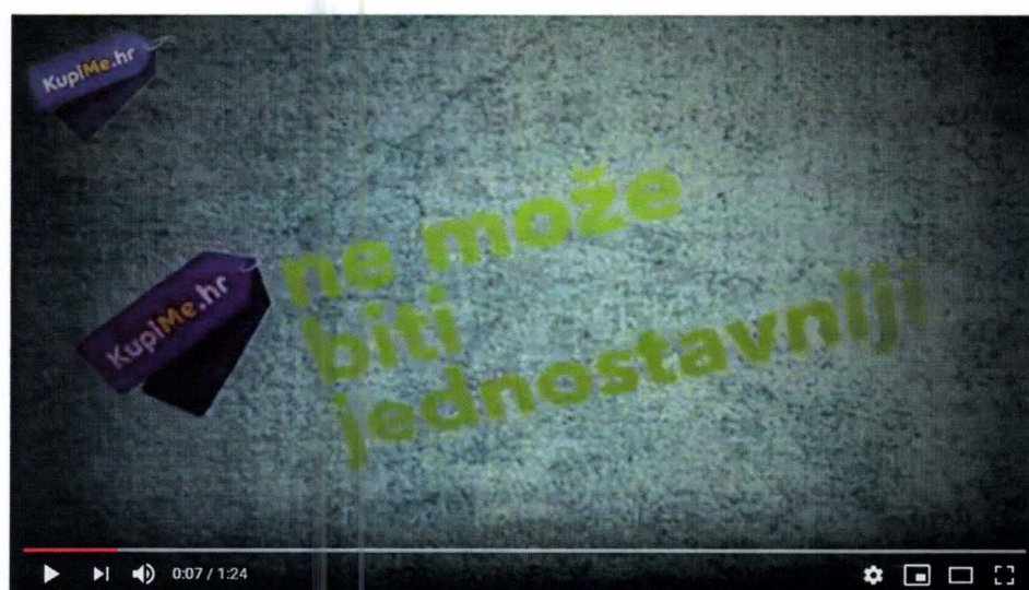
Kako Poslušemo /// KupiMe.hr