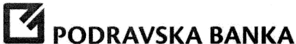
Slika 3. Logo Podravske banke d.d.

Podravska banka d.d. je među najstarijim bankama u Hrvatskoj. Ima svoju stoljetnu tradiciju koju primjenjuju u 22 poslovnice na području Hrvatske. Stalno ulaže u svoje zaposlenike kako bi postigli standard najboljih banaka, te kreativnim i inovativnim načinima slažu ponude z svakog klijenta individualno.